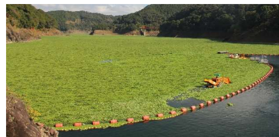
水草に大繁殖した鶴田ダム湖

どちらも、かわいらしい水草ですが、条件が揃うと1カ月で10倍ほどに増えることもあり、2カ月で100倍、3カ月で1000倍と爆発的に増殖し、膨大な量になることがあります。令和元年11月、鶴田ダム湖で大繁殖し、湖面を埋め尽くしました。