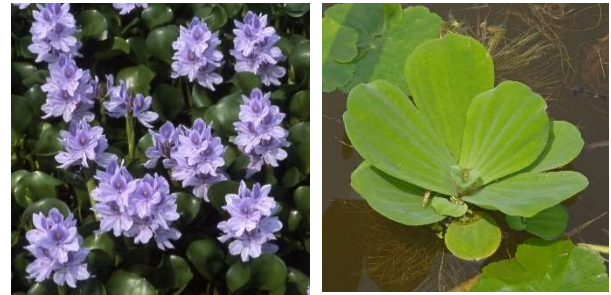
ホテイアオイ(左)、ポタンウキクサ(右)