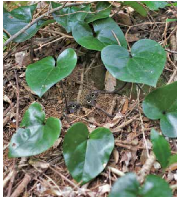
図3 トカラカンアオイ