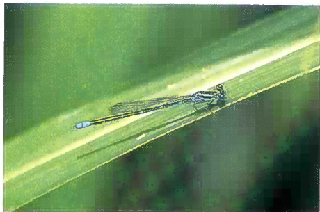
ムスジイトトンボ (♂) 1995. 7. 20