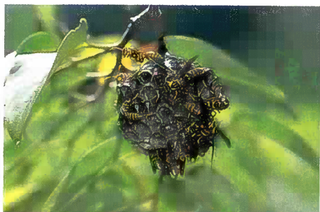
キアシナガバチ 1995. 7. 20