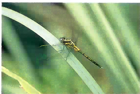
未熟なホソシオカラトンボ (♂) 1995. 7. 20