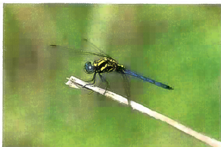
少し成熟したホソシオカラトンボ (♂) 1995. 7. 20