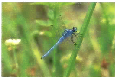
成熟したホソシオカラトンボ (♂) 1995. 7. 19