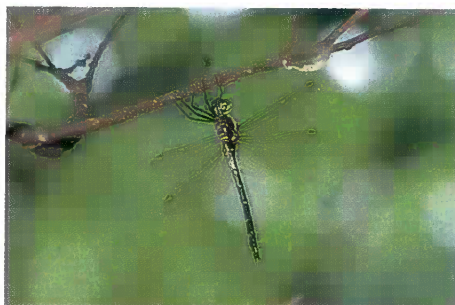
ミナミトンボ (♀) 1995. 7. 19