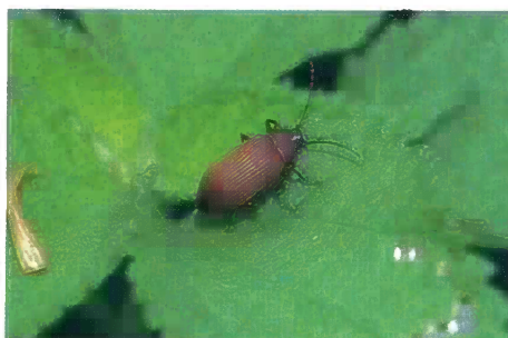
トカラチャイロクチキムシ 1995. 7. 19