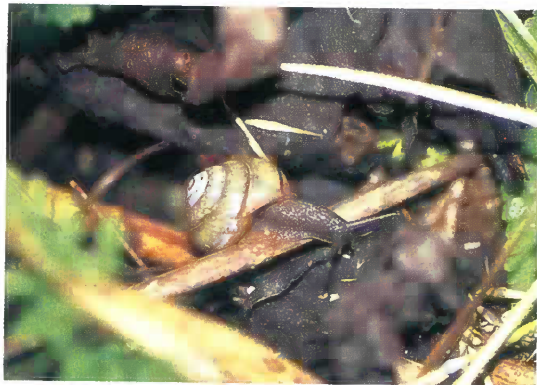
タネガシマイマイ