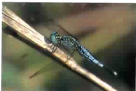
コシブトンボ (♂) 於茂登岳 1994. 10. 6