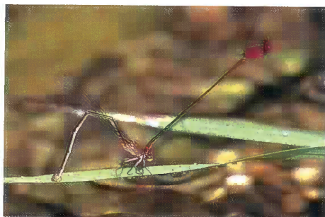
アカナガイトトンボ (産卵) 名蔵 1994. 10. 6