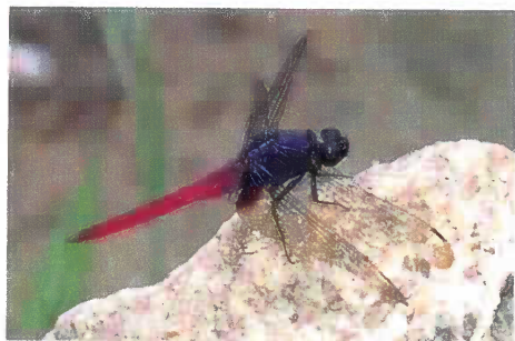
コフキショウジョウトンボ (♂) バンナ岳 1994. 10. 5