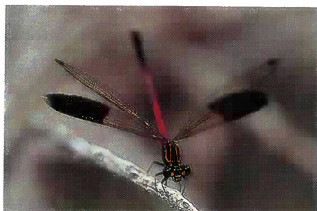
コナカハグロトンボ (♂) 名蔵 1994. 10. 5