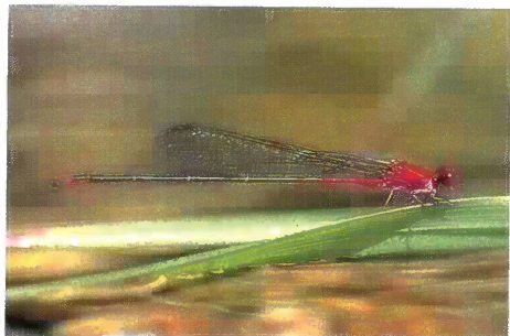
アカナガイトトンボ (♂) 名蔵 1994. 10. 6