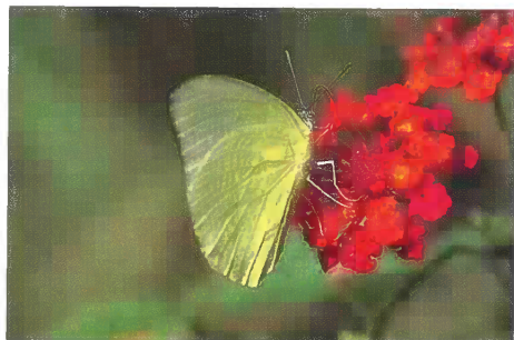
ウスキシロチョウ (♂) バンナ岳 1994. 10. 5