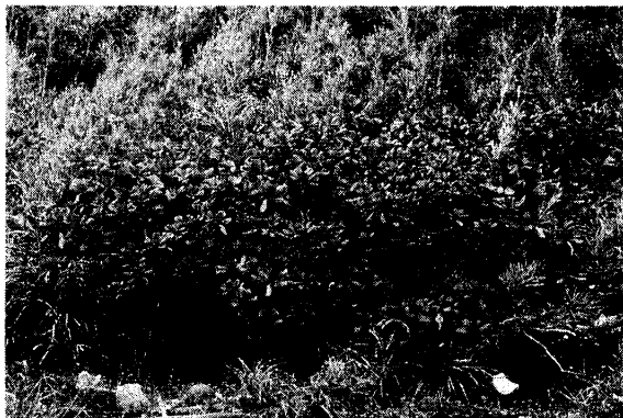
元浦港海岸のクサトベラ