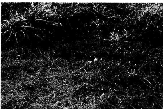
元浦港海岸のスナヅル