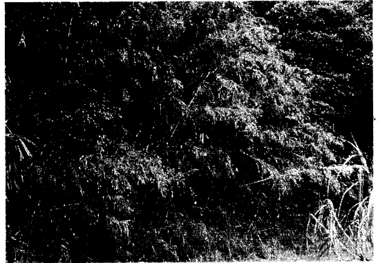
路傍のリュウキュウチク