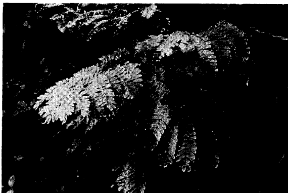
御岳登山口のヒロハネム