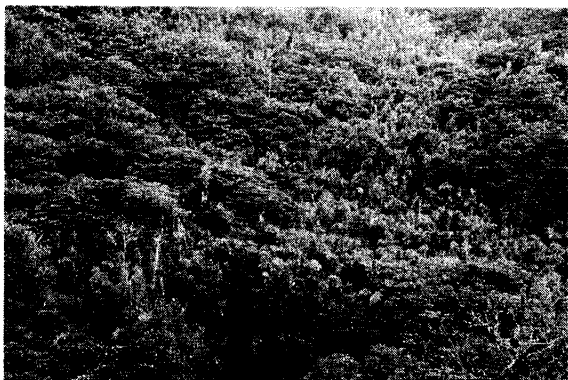
御岳登山口付近の広葉樹林