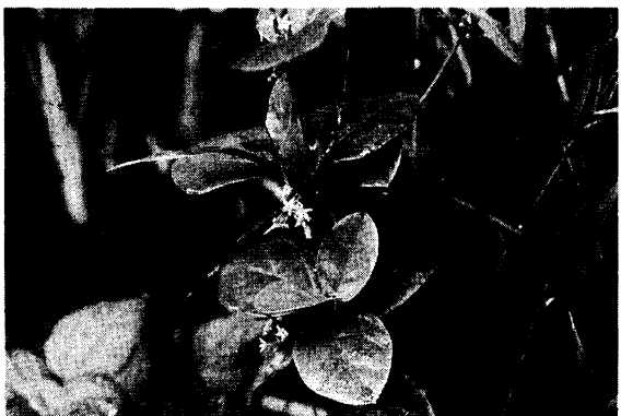
路傍のケナシツルモウリンカ