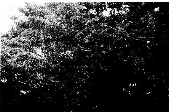
御岳登山口付近のイイギリ