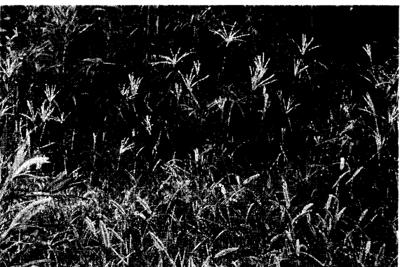
牧場付近のアフリカヒゲシバ