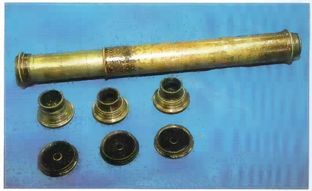
写真2 接眼レンズ群