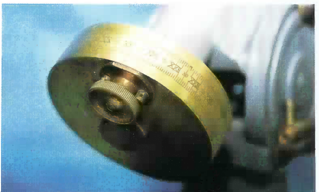
写真8 赤経部目盛環