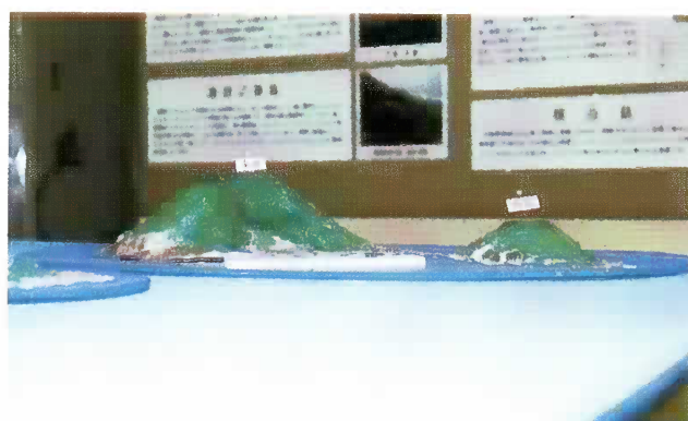
写真8 横当島正面図