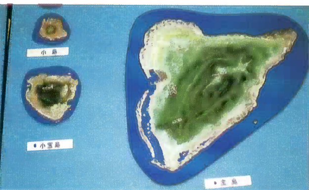
写真7 小宝島・宝島