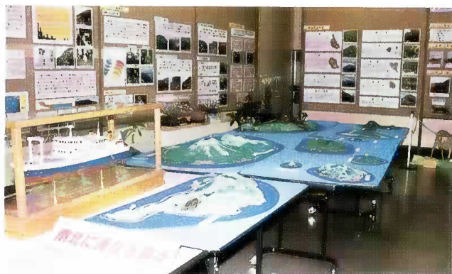
写真1 立体模型全景