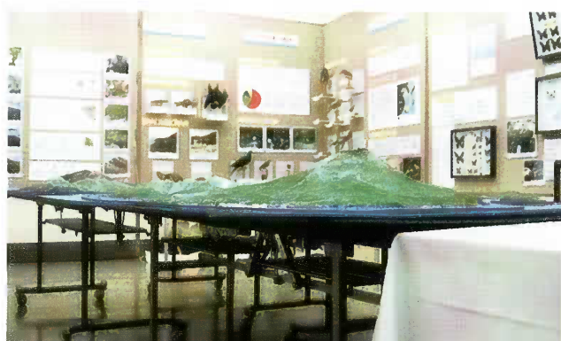
写真4 中之島御岳正面図