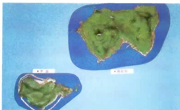
写真6 平島・悪石島