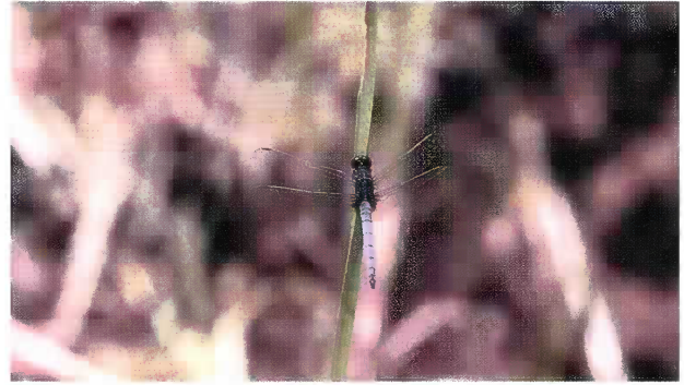
2 タイワンシオカラトンボ