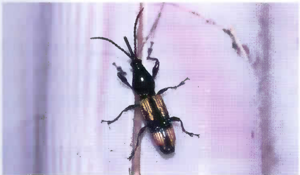
5 ヨツモンミツギリゾウムシ