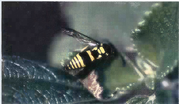
7 オオフトオビドロバチ悪石島亜種