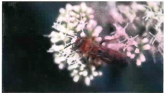
6 アカアシハラナガツチバチ