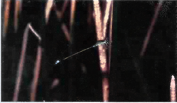
1 アオモンイトトンボ