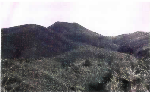
御岳方面 (一面のリュウキュウチク林)