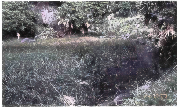
湯泊近くの池 (カンガレイ・フトイ群落)