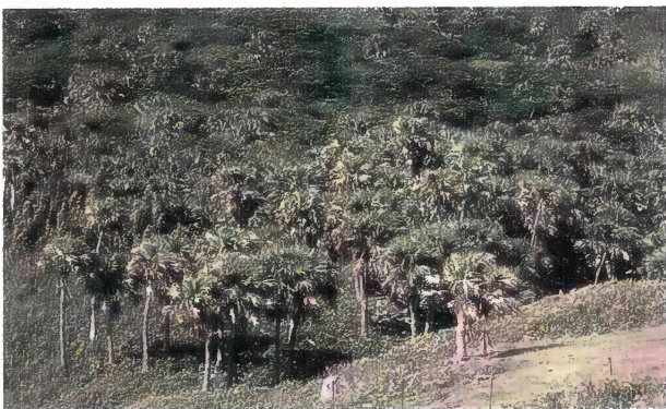
東海岸近くのピロウ林