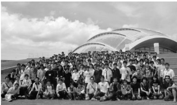
写真1 合同観測会の参加者

そこで当館は、皆既帯にある県立奄美少年自然の家と連携して、全国の中学生・高校生を対象とした皆既日食の合同観測会を開催した。このような観測会は、これまで前例のない実践だったので、その経緯及び成果をここに報告する。