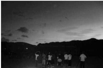
写真5 皆既中の空(大島北高)

朝の天候は薄曇りで、太陽の輪郭が分かる状態だったため観測準備は順調であった。ところが、第一接触が過ぎたころから雲が厚くなり、皆既の間も太陽の輪郭が見えない状態が続いた。そのため、自然の家と大島北高のいずれも日食の経過や皆既中の空を観測することはできなかった。