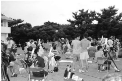
写真4 日食観測の様子

大島北高で観測するチーム(7チーム50人)は、フェリー到着による道路の渋滞を避けるために午前4時30分に自然の家を出発した。残りのチームは、前日のリハーサルと同じ場所で観測に臨んだ。