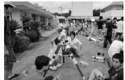
写真3 観測リハーサル

観測の手順を確認するために日食と同じ時刻に合わせて観測リハーサルを行った。空は時おり雲が通