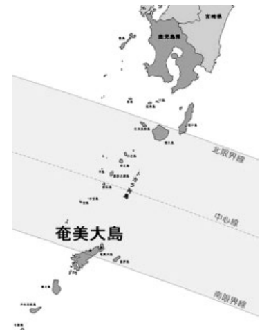
図1 皆既帯と観測地

観測地は自然の家の敷地内である(図1)。ここは皆既帯の南限界線に近く、皆既日食継続時間が2分18秒と短いものの、前日からの観測準備が容易である。また、少しでも皆既日食の時間を多く必要とする観測チームも予想され