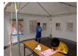
【コミュニティスポーツクラブコーナー】