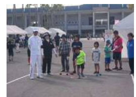
【ペタンク体験教室】