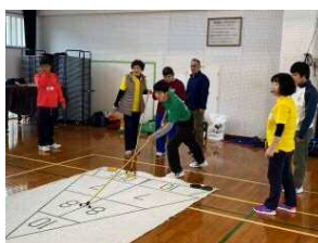
【シャッフルボード】