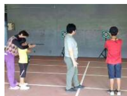
【スポーツウエルネス吹矢体験教室】