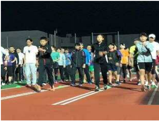
【いぶすき菜の花マラソン挑戦講座】 N P O 法 人 S C C