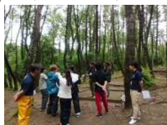
【ゲームプランニング実地調査】