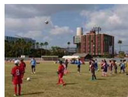
【鹿児島ユナイテッドFCサッカー教室】