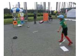
【ニュースポーツ体験コーナー】