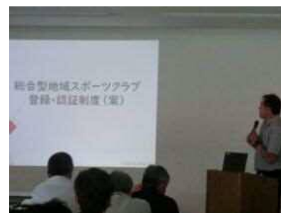
【登録・認証制度の整備について】