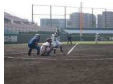
【中学校軟式野球交歓大会】