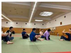
【ウォーミングアップ】