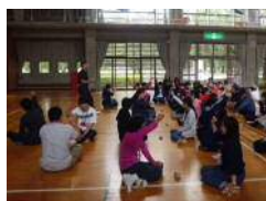
【アイスブレイキング】

アイスブレイキング，食材獲得ゲーム，野外炊事，屋台制作，料理コンテスト等の活動を体験しました。