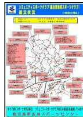
【コミュニティスポーツクラブの設立状況】

www.pref.kagoshima.jp/kikan/taiku/index.html