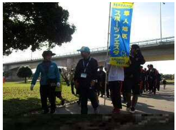
【隼人地区スポーツフェスタ】 N P O 法 人 隼 人 錦 江 ス ポ ー ツ ク ラ ブ