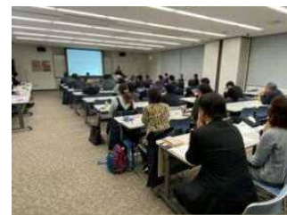
【 講演 の 様子 】