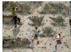
【スポーツクライミング】