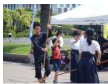
【なぎなた体験教室】 南九州剣道クラブ