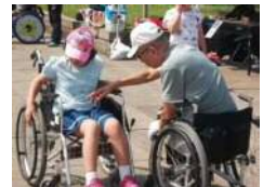
【車いすスラローム】