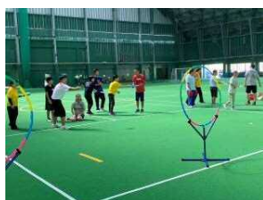
【フライングディスク】