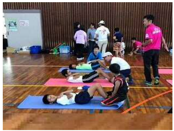
【みんな元気！体力づくり2019in南九州】 南 九 州 ス ポ ー ツ ク ラ ブ