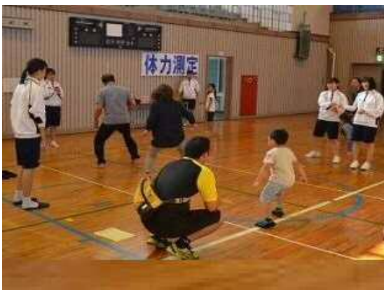
【 夢 わ く フ ェ ス タ 】 い ず み わ く わ く 夢 ク ラ ブ