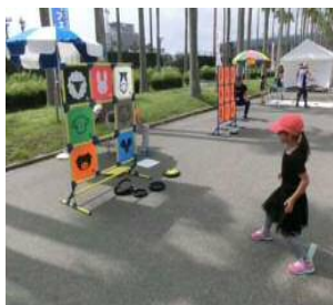
【ドッチビー・ディスクゲッター】