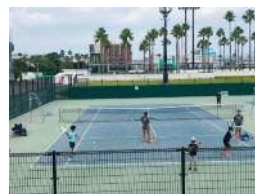
【テニスコート一般開放】