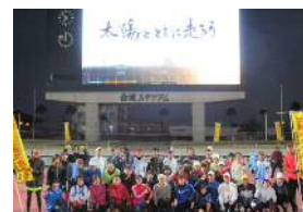
【薩摩チェスト太鼓保存会】 【薬丸野太刀自顕流保存会】 【鹿児島凧の会】 【鹿児島走ろう会】