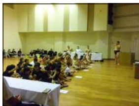
【講 話】 「相撲の歴史と技術について」

公益財団法人日本武道館から派遣された中央講師2人と本県各武道連盟から派遣された地元講師2人が、2日間の錬成大会の指導を行いました。