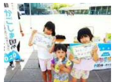
【かごしま団体・かごしま大会PR】