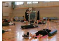
【リラククスストレッチ】