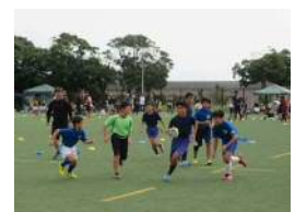
【タグラグビー・ミニラグビーフェスタ】