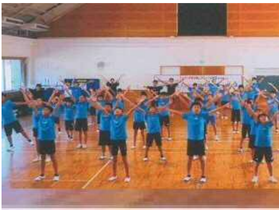
【かごしま国体・かごしま大会 「ゆめ～KIBAIYANSE～」ダンスメドレー】 コ ミ ュ ニ テ ィ ス ポ ー ツ ク ラ ブ チ ェ ス ト 伊 集 院