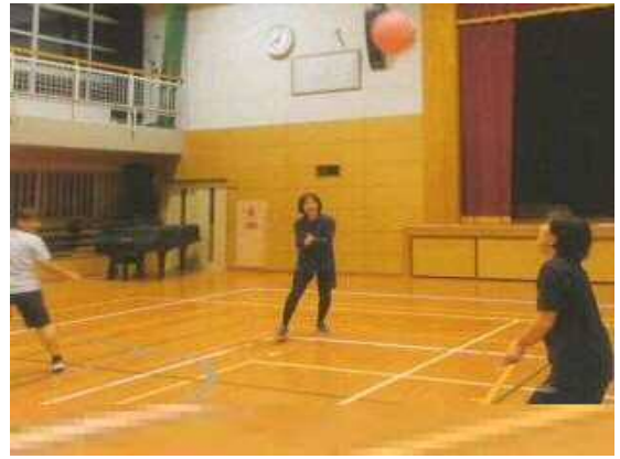
【わくわくスポーツランド】 ソ ン タ ス ポ ー ツ ク ラ ブ