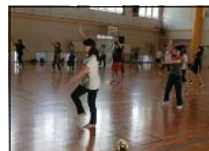
【ソフトエアロビクス】