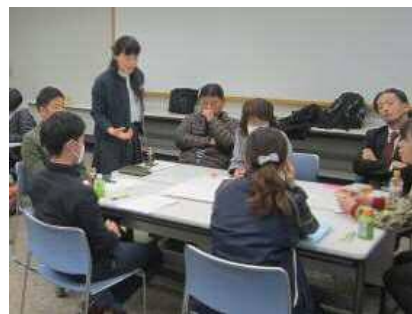
【 グループワークの様子 】