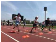
【かけっこ教室】 NPO法人SCC