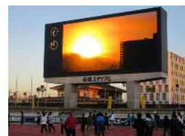
【ウォーキングやジョギングに親しむ参加者】 【大型ビジョンに映える初日】