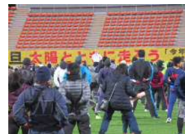
【開会のあいさつ】 【ゲストランナー紹介】 【準備運動】