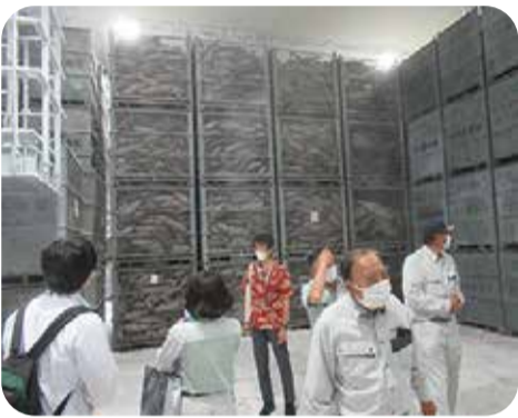
山川町漁協の冷凍冷蔵施設を視察＝指宿市・8月

また、衛生管理体制の強化等を行い、水産物の付加価値向上や販路開拓に取り組む山川町漁協を視察しました。