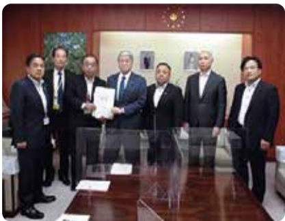
農林水産大臣への要望=東京都・9月