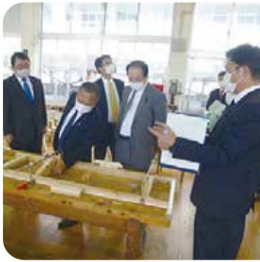
人材育成への取組を視察(川内商工高等学校)＝薩摩川内市・11月

また、特別支援学校を訪問し、施設の状態や授業等の視察を行ったほか、特別支援教育に係る課題等について保護者等と意見交換会を行いました。