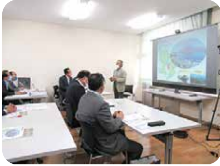
地域の活性化に取り組む大野地区公民館との意見交換＝垂水市・5月

また、三島村のジャンベスクールを訪問し、ジャンベ留学生と地域との交流等の取組について調査を行いました。