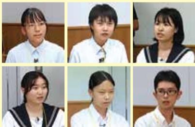
参加された高校生の皆さん