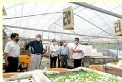
就労継続支援B型事業所の視察=6月