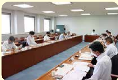
関係団体との意見交換会=7月