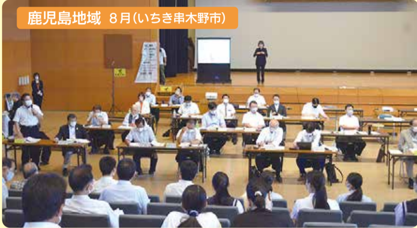
鹿児島地域 8月(いちき串木野市)

若者の県外流出対策、環境保全の取組、農畜産業の振興、地元高校の存続、洋上風力発電などについて意見を交わしました。