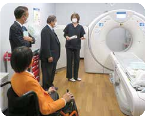
経営改善の取組を調査(県立北薩病院)＝伊佐市・11月

また、北薩地域振興局さつま庁舎を訪問し、新たな児童相談所設置の取組について説明を受けた後、庁舎を視察しました。