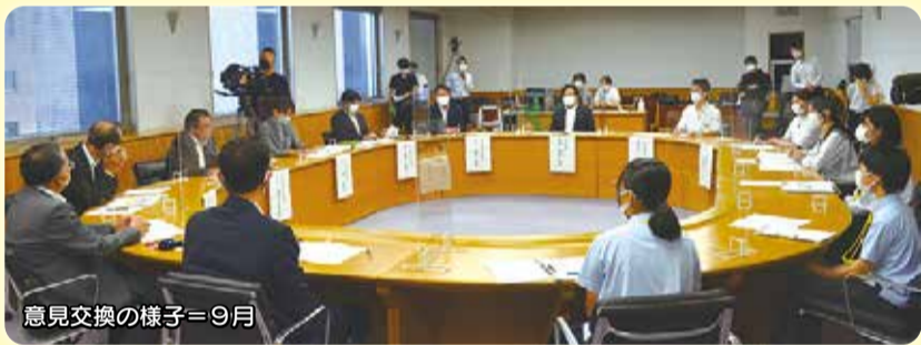
意見交換の様子=9月

鹿児島地域で開催した「そば県」に参加した高校生（市来農芸高校、串木野高校、神村学園高等部 各2名）を県議会に招待し、庁舎見学や本会議傍聴、議員（広報委員7名・いちき串木野市区選出議員）との意見交換を行いました。意見交換会では、そば県での質問を発展させたものや日頃感じる社会的な課題などについて活発な議論が交わされました。高校生たちの意見が県政に反映されるよう取り組んでまいります。