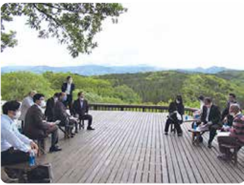
富裕層向けの宿泊施設を経営する方との意見交換=霧島市・5月