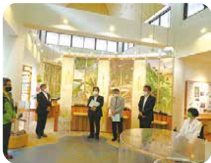
環境保全の取組について意見交換(奄美野生生物保護センター)＝大和村・5月

また、湧水町のMEC Industry(株)を訪問し、県産材等を活用し、建材等の製造・加工・販売までを一気通貫で行う取組について説明を受けた後、施設を視察しました。