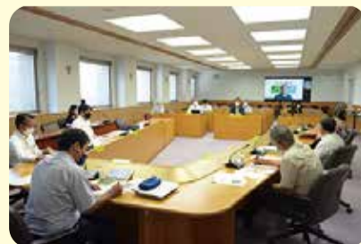
関係者との意見交換会=8月