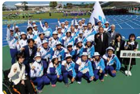
選手団を激励=栃木県・10月