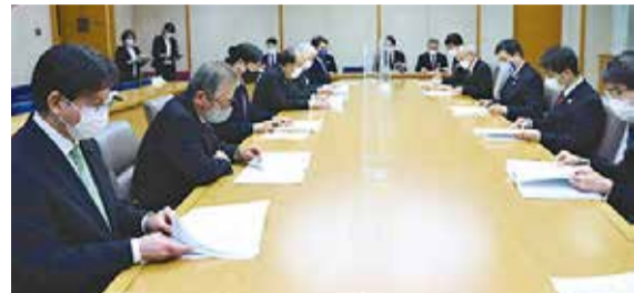
提言内容を知事に説明する議長と代表委員