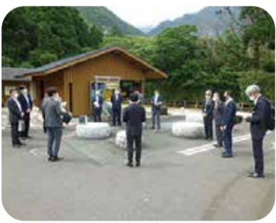
観光客受入整備の状況を調査(千尋の滝)＝屋久島町・5月

また、スポーツ振興に取り組むNPO法人やクラブチームを訪問し、スポーツ振興に係る取組や課題等について視察を行いました。