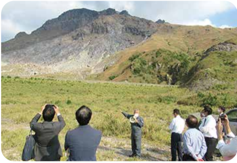
硫黄岳の噴火対策等を調査＝三島村・11月

また、三島村硫黄島において、硫黄岳の活動状況や噴火対策について調査を行いました。