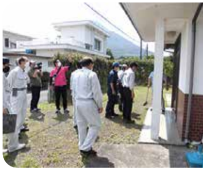
空き家対策による地域活性化の取組について意見交換＝指宿市・5月

また、廃校を活用したサテライトオフィス整備による関係人口の創出や企業誘致に取り組む南九州市の施設の調査を行いました。