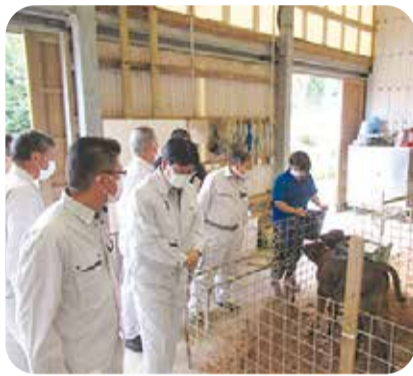
畜産農家の牛舎を視察＝中種子町・5月

また、県農業開発総合センターを訪問し、サツマイモ基腐病対策やスマート農業技術に関する研究等について調査を行いました。