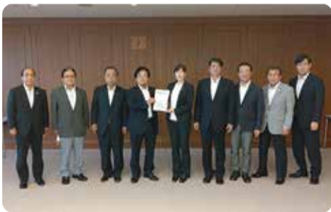
防衛省への要望=東京都・9月