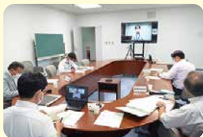
オンライン調査=8月