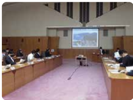
国道10号の整備状況についての勉強会=9月