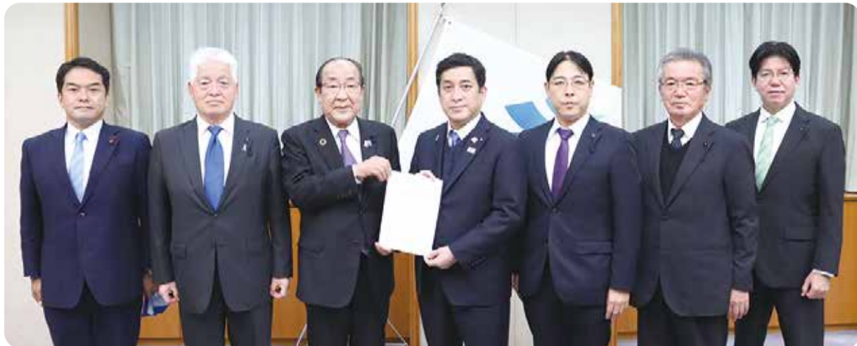
塩田知事に提言書を渡す正副議長と政策立案推進検討委員会の代表メンバー