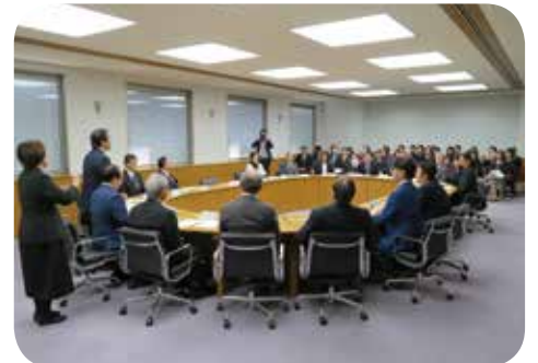
関係団体の方々との意見交換