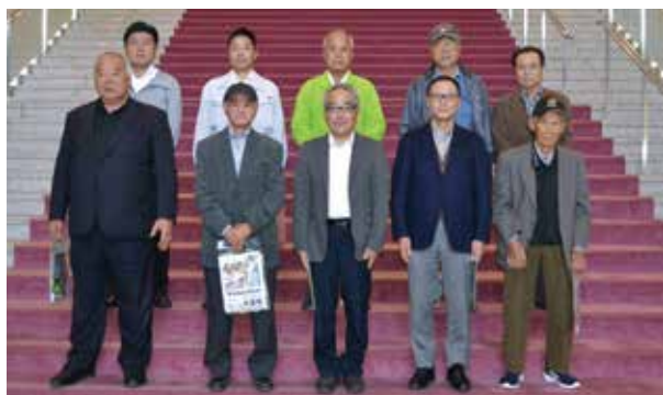
大崎町自治公民館連絡協議会の皆さん

令和元年度は30団体526人が見学にいらっしやいました。皆様も、ぜひ見学にお越しください。