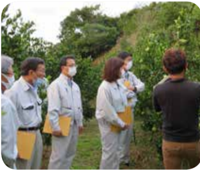
果樹園のたんかん圃場を視察＝平井果樹園(奄美市)

たんかんの生産において奄美地域をリードする果樹園や、鮮度保持処理や衛生管理の徹底等により水産物の付加価値向上や販路開拓に取り組む漁協を視察しました。