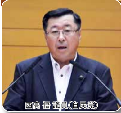
西高 悟 議員(自民党)