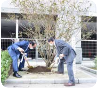
記念植樹の様子=11月

県議会議員が見守る中、外菌議長と堀之内副議長により、県議会庁舎の緑地帯に「ハヤトミツバツツジ」が植樹されました。