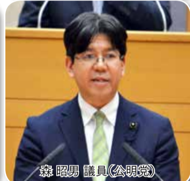
森 昭男 議員(公明党)