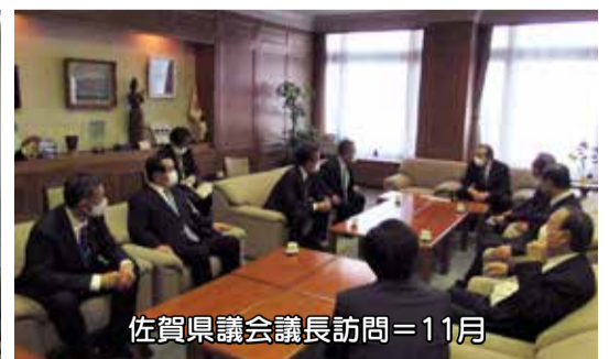
佐賀県議会議長訪問=11月

2020年の開催が延期になった「かごしま国体・かごしま大会」については、早期開催に向けて、県議会としても知事とも連携しながら関係者へ働きかけを行い、2023年に開催されることが決定しました。11月には総務委員会が佐賀県知事と同県議会議長を訪問し、御協力への謝意を伝えるとともに、今後の連携に向けて意見交換を行いました。