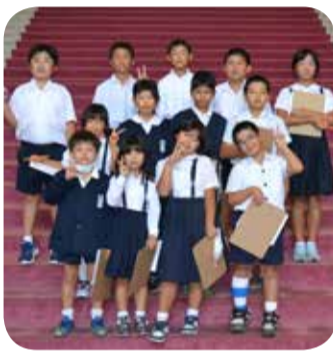
南さつま市立内山田小学校の皆さん

なお、手話通訳や要約筆記を希望される方は、傍聴日の5日前までにご連絡ください。また、議会庁舎を見学することもできますので、希望される方は、お気軽にお申し出ください。