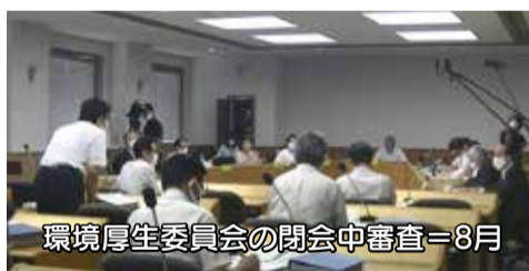
環境厚生委員会の閉会中審査=8月

新型コロナウイルス感染症の感染拡大に迅速に対応するため、県議会では、徹底した感染防止策を講じたうえで、環境厚生委員会の閉会中審査(4月・8月)や臨時会(8月)を開催し、県内の感染状況や感染防止対策、経済対策などについて議論しました。