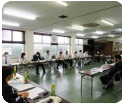
あまみ大島観光物産連盟との意見交換＝奄美市

黒糖焼酎の製造等で奄美大島の地域振興に取り組む(株)奄美大島海運酒造を視察したほか、奄美パークを拠点とした群島全体の観光振興の取組や、魅力ある観光地づくり事業を活用した施設の整備状況について現地調査を行いました。また、観光物産連盟の方々と、奄美らしい観光地づくりによる地域活性化の取組について意見交換を行いました。