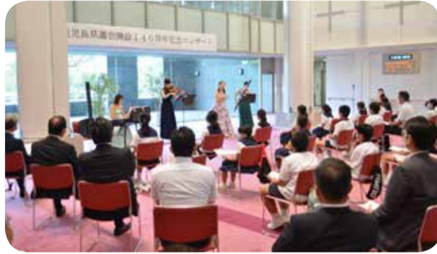
記念コンサートの様子=9月

昨年に創立140周年を迎えた鹿児島市立宮小学校の児童を県議会に招待して、みやまコンセルの協力演奏家による記念コンサートを開催しました。