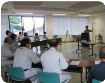
ゲストハウスの運営会社等との意見交換＝錦江町

中山間・集落対策の取組について調査を行うとともに、空き家を活用してゲストハウス「よろっで」を整備し、地域おこしに取り組む民間の運営会社等と現状や課題について意見交換を行いました。また、令和2年2月に運転を開始した錦江町の木質バイオマス発電設備を視察し、事業実施に伴う課題や今後の展望等について説明を受けました。