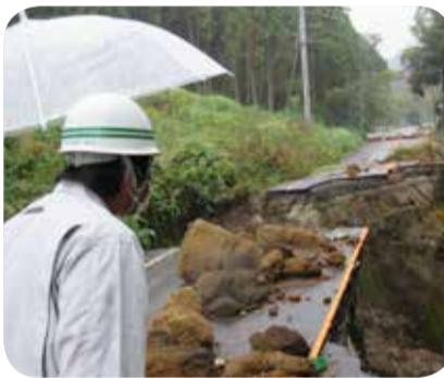
国道269号の災害復旧現場＝鹿屋市

令和2年7月豪雨により被災した国道269号(鹿屋市串良町細山田工区)の道路災害復旧事業について現地視察を行いました。