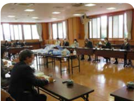
始良保健所での現状調査＝霧島市

始良保健所を訪問し、新型コロナウイルス感染症対応状況等について調査を行いました。併せて、感染症患者隔離搬送用資機材、ホールボディカウンタ等搭載車の見学を行いました。