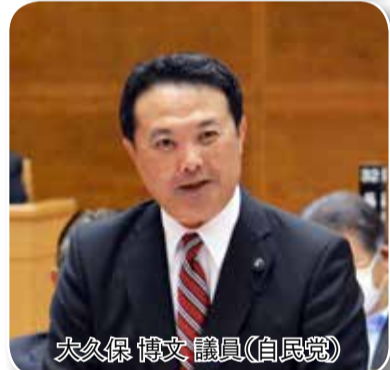
大久保 博文 議員(自民党)