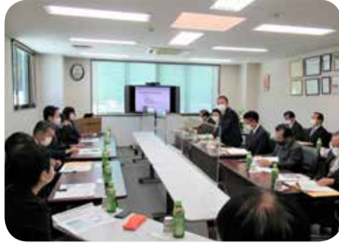
女性活躍の推進に取り組む企業を訪問 ＝(株)新日本科学(鹿児島市)

女性が活躍できる職場環境づくりに取り組んでいる企業を訪問し、取組に至った経緯や取組内容、成果や課題等について説明を受けるとともに、施設内の視察を行いました。