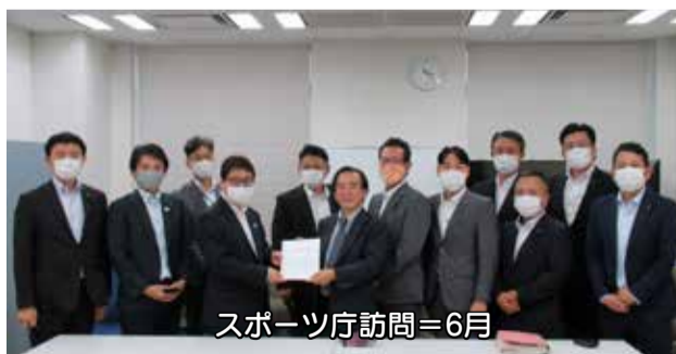
スポーツ庁訪問=6月