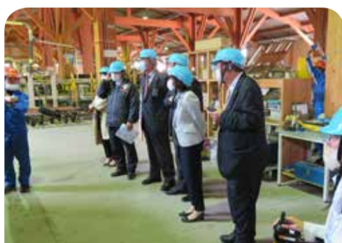
県産材を利用した住宅部材加工施設の見学＝(株)さつまファインウッド(霧島市)

霧島市の木材加工販売業者を訪問し、県産材による2×4住宅部材の加工施設の取組状況と木材需給の現状について説明を受け、意見交換を行いました。その後施設を見学しました。また、森林技術総合センターでは、森林・林業に関する技術開発等の説明を受け、現地視察を行いました。