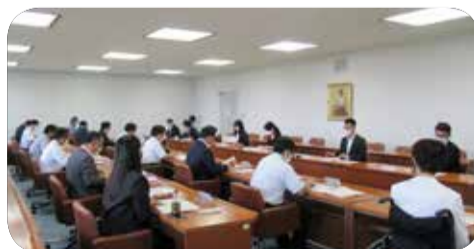
関係団体等との意見交換=9月

今年度も、「医療的ケア児者の支援」について、関係団体等と意見交換を行うなど政策提言に向けて議論を重ねています。