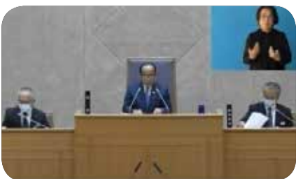
県議会のインターネット中継画面