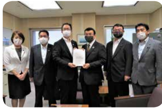
教育長(写真左から3人目)に要望書を渡す観光産業議員連盟=6月

6月19日及び7月30日、教育長に対して、新型コロナウイルス感染症対策の基本的対処方針を踏まえ、万全の感染症対策を講じた上で、県内の各地域相互間での修学旅行が実現するよう要望を行いました。