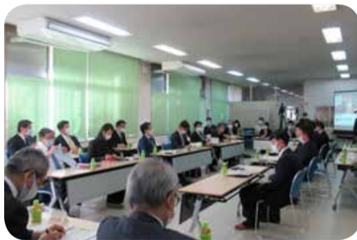
県立楠隼中学校・高等学校における意見交換＝肝付町

県立楠隼中学校・高等学校を訪問し、開校からの取組について説明を受けた後、今後の課題等について教職員や保護者等との意見交換を行ったほか、授業や校内の視察を行いました。