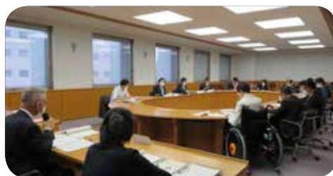
第5回政策立案推進検討委員会=11月