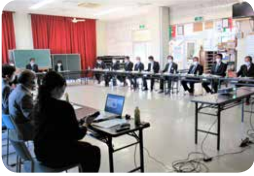
地域課題の解決に取り組む自治会との意見交換＝福元区自治会(指宿市)

過疎・高齢化が進む中、地域住民が連携して様々な地域課題の解決に取り組んでいる自治会を訪問し、取組内容等について説明を受けるとともに、取組の課題等について意見交換を行いました。