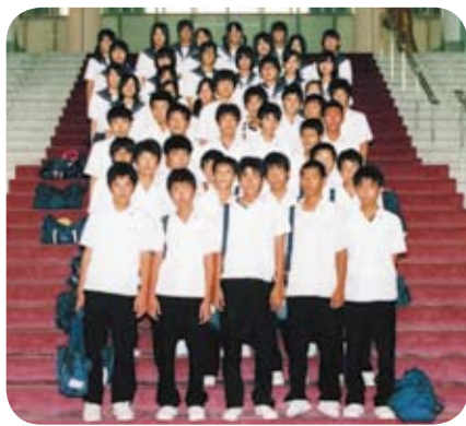
霧島市立舞鶴中学校の皆さん

また、議会庁舎を見学することもできますので、希望される方は気軽にお申し出ください。