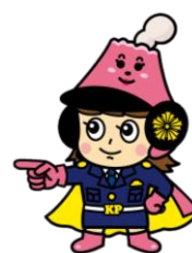
さくらロールちゃん

警察本部ホームページURL ◆ https://www.pref.kagoshima.jp/police/