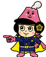
さくらロールちゃん

警察本部ホームページURL ◆ https://www.pref.kagoshima.jp/police/