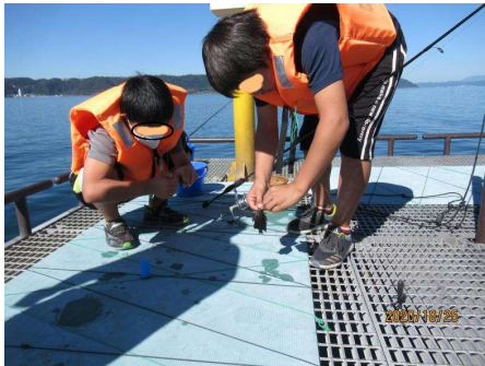
居場所づくり(釣り)