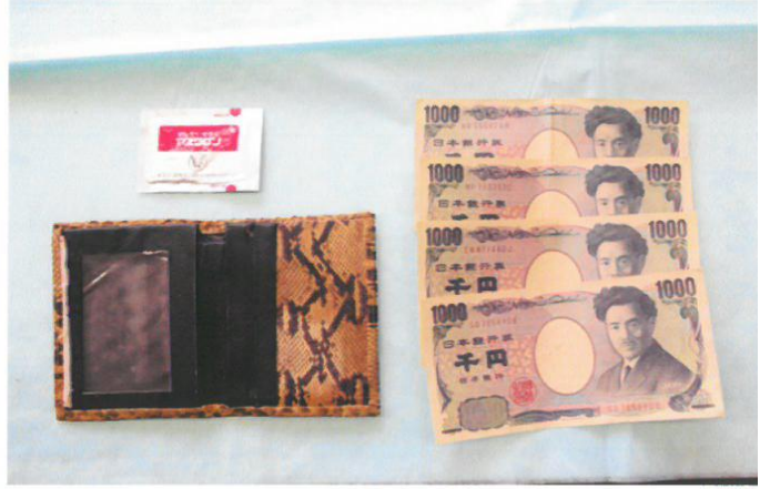
○財布在中品の状況