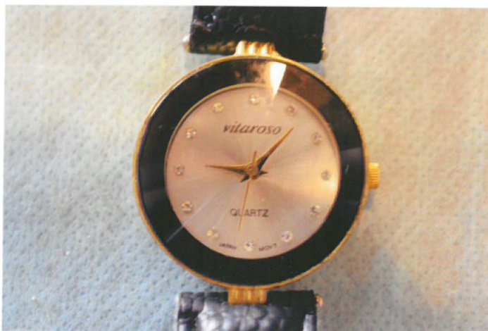
○腕時計文字盤の状況