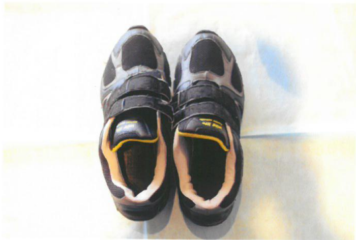
○運動靴 (Wild Life)