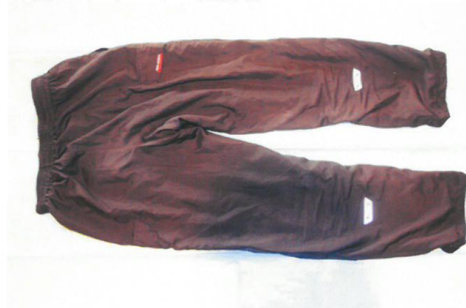
○黒色ジャージ（背面）