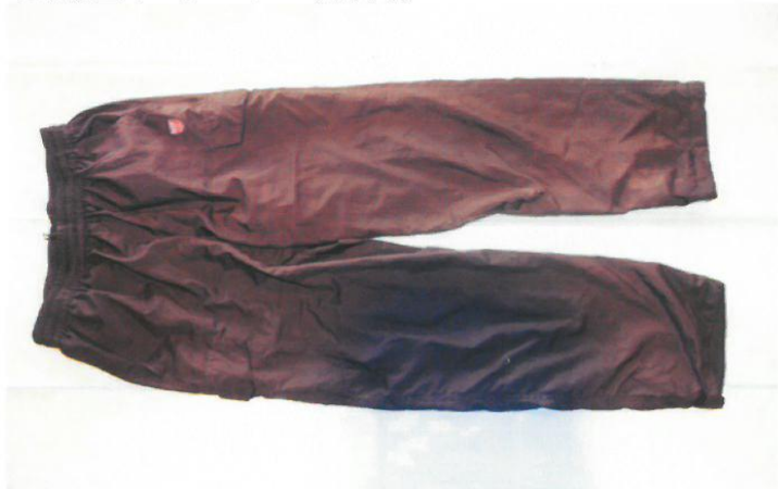
○黒色ジャージ（前面）