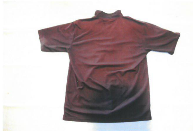
○黒色ポロシャツ（背面）