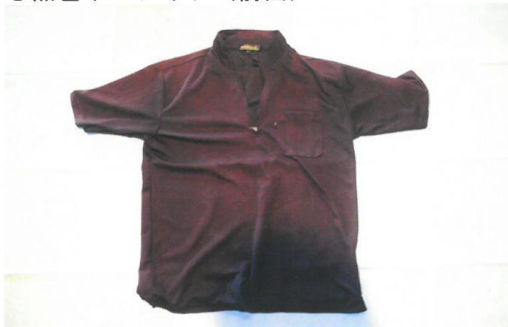
○黒色ポロシャツ（前面）