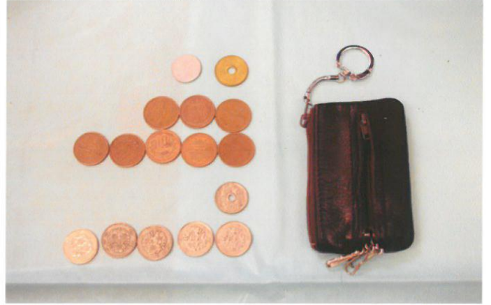
○小銭入れ在中品の状況