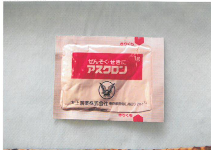
○咳止薬（アスクロン）