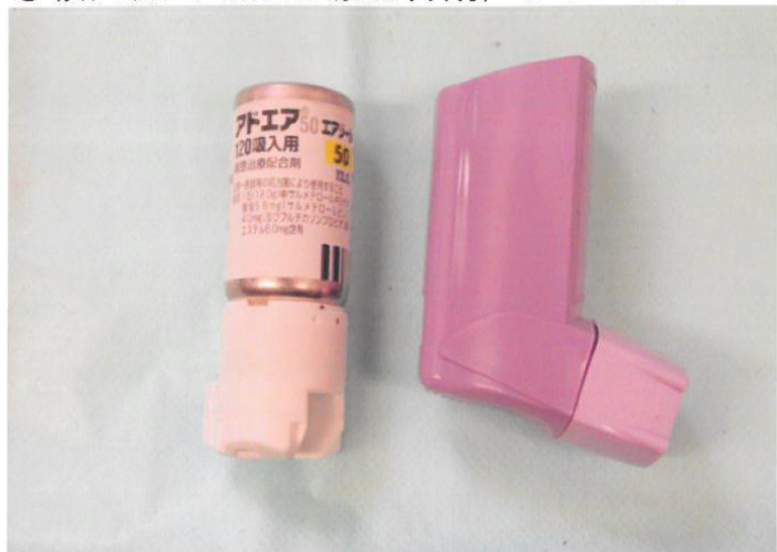
○吸入器（喘息治療配合剤，アドエア）