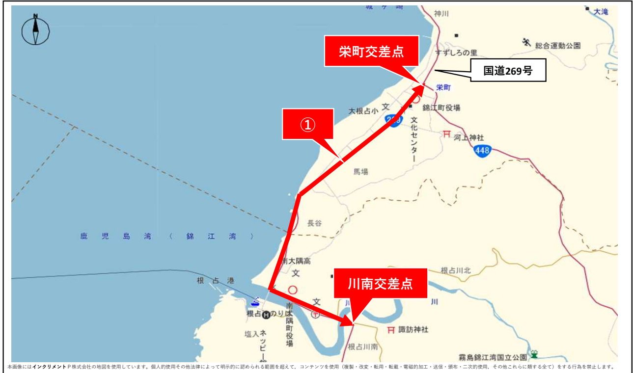
本画像にはインクリメントP株式会社の地図を使用しています。個人的使用その他法律によって明示的に認められる範囲を超えて、コンテンツを使用(複製・改変・転用・転載・電磁的加工・送信・頒布・二次的使用、その他これらに類する全て)をする行為を禁止します。