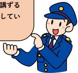
自転車に関する交通事故の発生状況 (出水署管内・令和7年中)

警察では、自転車運転者の信号無視等に対し、指導警告を行うとともに、悪質・危険な交通違反に対しては検挙措置を講ずるなど、厳正に対処しています。