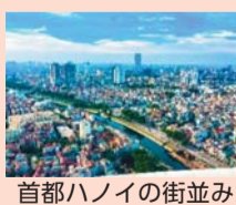
首都ハノイの街並み

【正式名称】ベトナム社会主義共和国 【人口】約9,500万人(2018年) 【首都】ハノイ 【言語】ベトナム語