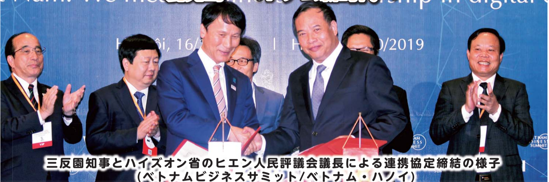
三反園知事とハイズオン省のヒエン人民評議会議長による連携協定締結の様子 (ベトナムビジネスサミット/ベトナム・ハノイ)