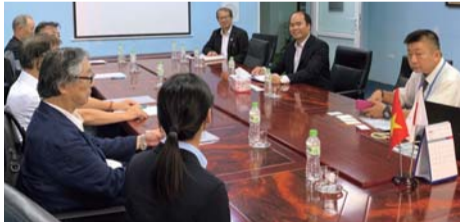
県医師会と送り出し機関の意見交換

この他、技能実習生の送り出し機関などの関係機関を視察し、製造業・農業・建設業・介護分野等の優れた人材の送り出しを要請しました。