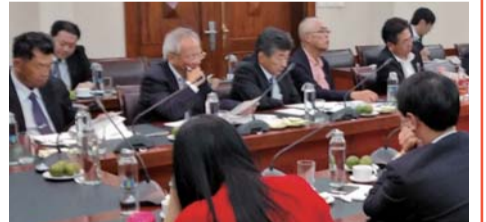
JAと農業農村開発省との意見交換