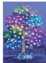
イルミネーションイメージ

鹿児島中央駅前のシンボルツリー“クスノキ”がイルミネーションで彩られます。高さ約20mの大きなクスノキが、さまざまな表情で光り輝く空間は圧巻! ぜひお楽しみください。