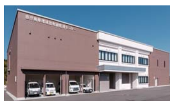
環境放射線監視センター

川内原発周辺地域住民の安全の確保と環境の保全のため、原発周辺地域における空間放射線量や環境試料の放射線の調査を行っています。