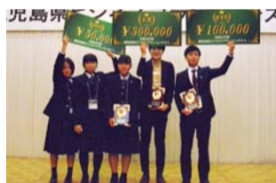
コンテストの受賞者

県内で起業予定の方等を対象に開催し、事業プランの改善や投資家等とのマッチング機会を創出します。