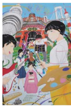
2022とうきょう総文ポスター原画

高校生最大の芸術文化の祭典を象徴し、鹿児島らしさが多くの人に伝わるポスター原画を募集します。