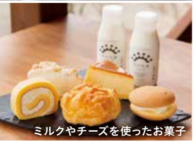
ミルクやチーズを使ったお菓子