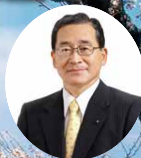
鹿児島県知事 伊藤祐一郎

平成28年度当初予算の編成に当たっては、地方創生の取り組みをさらに加速化するため、平成27年度3月補正予算と合わせて299億円の地方創生関連事業経費を計上するとともに、「行財政運営戦略」を踏まえた行財政改革を着実に進めながら、経済や雇用の回復に努めつつ、明るい展望をもって着実に歩みを進め、県勢の発展を図る観点から、「新たな未来への挑戦 “安心・活力・改革”」の予算としての編成を行い、8年連続のプラス予算といたしました。