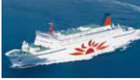
平成30年新船就航予定