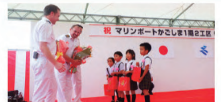
サファイア・プリンセスのブルーへ花束贈呈