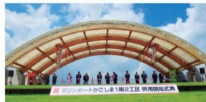
ながめの丘で行われたテープカット

大型観光船ふ頭とあわせて、県民や観光客が憩い、海と触れ合える緑地空間として鹿児島港に整備を進めてきたマリンポートかごしまに、「ふれあい広場」や「潮風ロード1000」などを新たに整備し、7月18日に全面オープンしました。