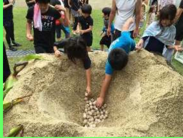
ウミガメの卵移設