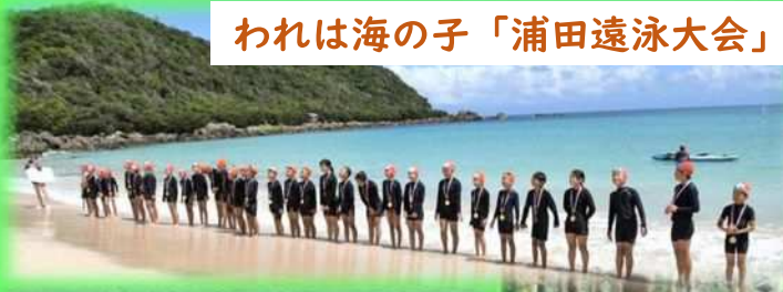
われは海の子「浦田遠泳大会」