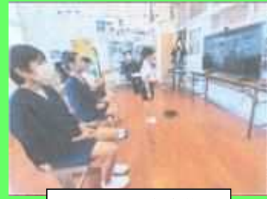
オンライン交流学習