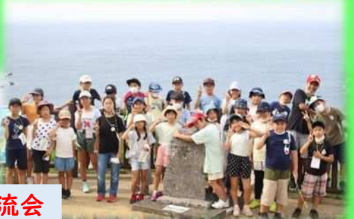
留学生同士の交流会