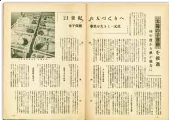
[昭和44年4月号] 21世紀の人づくりへ 太陽の子運動を推進