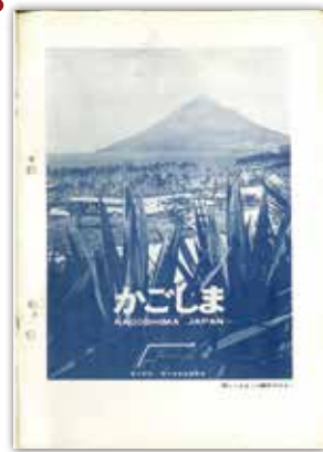
[昭和43年7月号] 表紙裏 新しく決まった観光ポスター