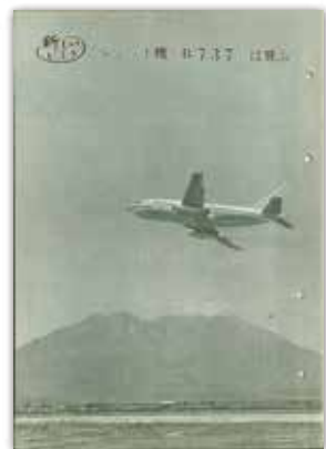
[昭和44年10月号] 新しいいぶき 桜島とジェット機「B737」就航の記事