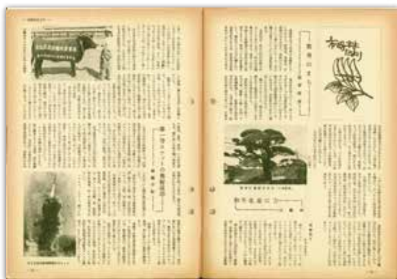
[昭和43年10月号] 市町村だより 左下に南種子町の第一号ロケットの発射成功の記事