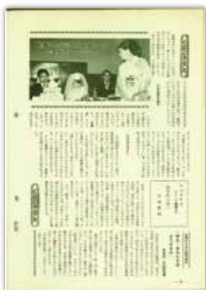
[昭和43年11月号] くらしのちえ 結婚式のマナーなど