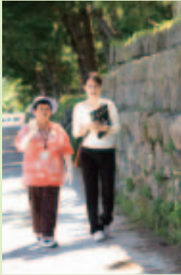
今和泉島津家別邸跡 (指宿市)

来年1月からNHK大河ドラマで放送される「篤姫」。現在も残る別邸跡の石垣に沿ってのんびり散策。ボランティアガイドの説明を聞きながら、篤姫の生きた時代にタイムトリップ(関連8ページ)。