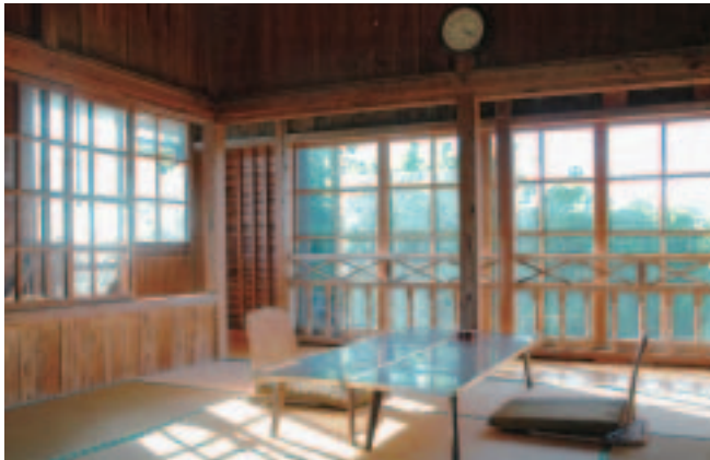
木枠の窓から漏れる柔らかい光に心が和む休憩所。手すりの細工、古い掛け時計も温かい雰囲気。ゆっくりお茶を飲んだり、お弁当を食べたりしながらくつろいでみては。

創業は明治25(1892)年。百年を超える長い間、庶民の湯として親しまれてきた、素朴で情緒ある温泉。 昔、弥次という人が掘り出したというのが、名前の由来だそうです。湯船は弥次ヶ湯のほか、大黒湯など4つあります。