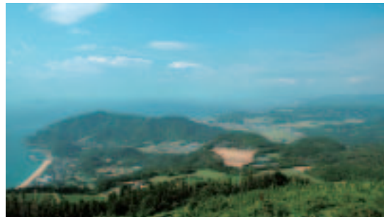
錦江湾奥、桜島方面を望む。

天気の良い日には、錦江湾、開聞岳、佐多岬、桜島のパノラマを一望できる標高500メートルの展望台。