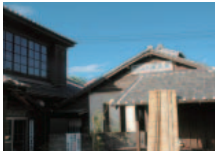
昔ながらの古い看板のかかった外観。建物は手入れをしながら丁寧に使われています。