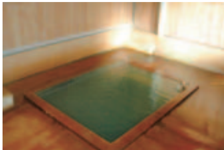
弥次ヶ湯。源泉かけ流しのお湯は、日によって温度が違うそうです。お湯が緑がかった灰色なのもひなびた雰囲気を増します。