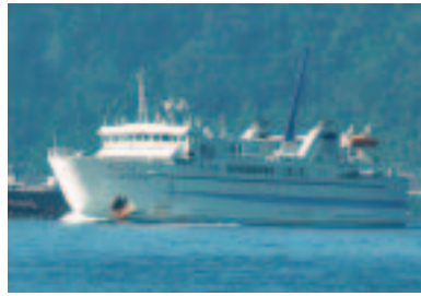
雄大な景色を楽しみながらゆっくりとした海の旅を満喫できます。