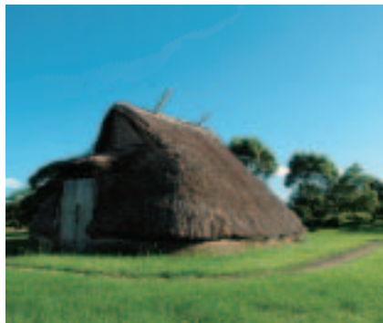
現在は史跡公園として、古代の村を復元。4棟の竪穴式住居と貝塚、地層の展示をしています。

今、縄文時代が弥生時代よりも古い時代であることは常識ですが、それを決定づけたのがこの遺跡。大正時代の発掘調査で縄文土器が弥生土器よりも古いことが日本で初めて証明され、大正13(1924)年に国指定史跡となっています。 遺跡に佇み古代に思いを馳せ、博物館で古代の人々の暮らしを体験してみてください。