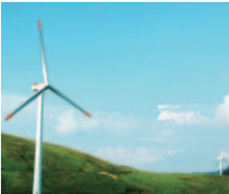
1号機展望所からの眺め。1号機展望所、7号機展望所が南大隅町によって設置されています。