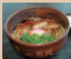
小牧花菜そば(しょうゆ仕立て)(580円)さばぶしのだしを使った風味豊かな手打ちそば。手作りのさつま揚げ、菜の花のトッピングも指宿らしい一品。