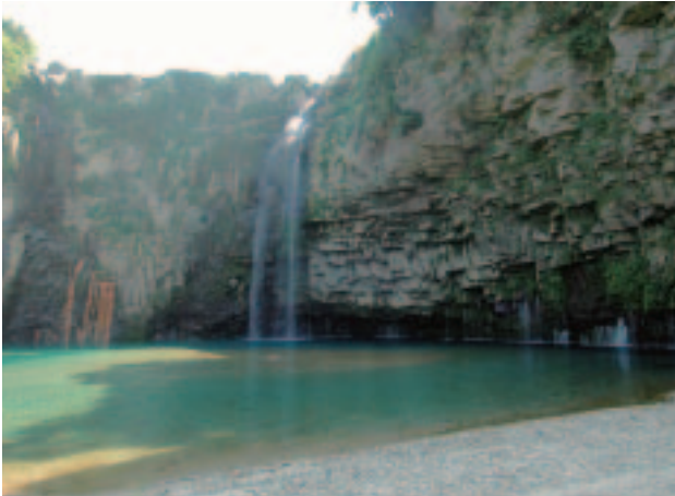
遊歩道の終点で目の前に現れる景観は息を飲むほど。青く澄んだ滝壺、その周りを取り囲むゴツゴツした断崖、細く長い滝、下層の岩肌から幾筋にも流れ落ちる白い水の線が清々しく、そこにいるだけで癒されます。

上流の雄川溪谷、雄川の滝は四季折々に表情を変え、手つかずの自然が残る知る人ぞ知るスポットです。