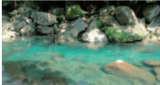
エメラルドグリーンの透き通った水の流れ。溪流沿いに緩やかな上りの遊歩道が整備されており、ゆっくり歩いて20分ほどで滝に到着します。

※遊歩道入口までの道幅は軽自動車が入りやすいです。道順などについては事前にお問い合わせください。