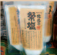
佐多の祭塩(1,000円)佐多地区の住民グループが佐多岬沖の海水から手作りで貴重な一品。