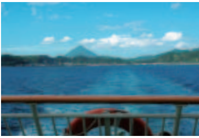
デッキに出て開聞岳や錦江湾を眺めていると50分はあっという間。

・旅客 大人(中学生以上) 600円 小人(小学生) 300円 ・車両 1850円