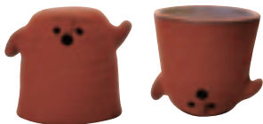
人気のミュージアムグッズ「はにまぐ」。

遺跡に隣接する博物館。遺跡の発掘調査で判明した古代の南九州の人々の暮らしを紹介する体験型ミュージアム。いつでも、まが玉つくりや古代あみものが体験できます。(1000円)