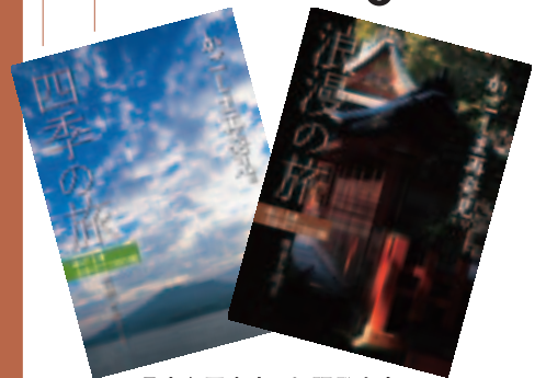
県内主要書店で好評発売中！ 初版限定価格 各680円(税込)