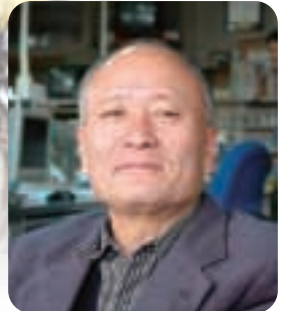
「バンクする選手がいないといいんですが」と語る淵之上さん。