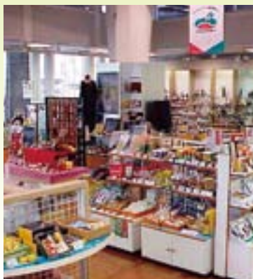
「鹿児島ブランドショップ」(県産業会館1階)