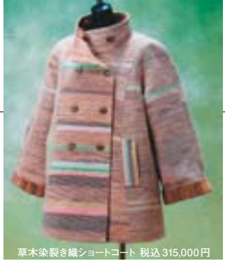
草木染裂き織ショートコート 税込315,000円

陶染工房 美ほう庵 〒891-3101 西之表市西之表6490-2 電話 0997-23-0326