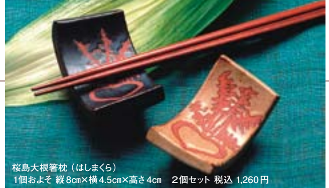
桜島大根箸枕 (はしまくら) 1個およそ 縦8cm×横4.5cm×高さ4cm 2個セット 税込 1,260円

眞窯 makotogama 〒891-0112 鹿児島市魚見町160-15 電話 099-266-3487