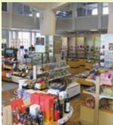
「鹿児島ブランドショップ」(県産業会館1階)