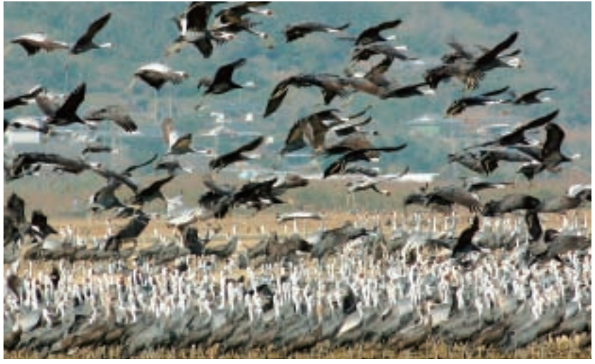
ツル監視員によると、「ねぐらからエサ場に向う早朝がツル観察に一番おすすめの時間」だそうです。