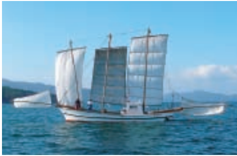
出水の海岸からけたうたせ船の白い帆を遠くに見ることができます。

ツルと並ぶ出水の冬の風物詩、真っ白な帆が印象的なけたうたせ船。出水では全国でも珍しい伝統的な漁法「うたせ漁」が今も行われています。 うたせ漁は、熊手のような「けた」を使って砂の中のクマエビを捕るもの。毎年11月1日から3月中旬まで期間限定で行われ、捕れたクマエビは焼きエビに加工され、高級品として取引されています。 けたうたせ船は、水産庁が平成18年に実施した「未来に残したい漁業漁村の歴史文化財産百選」に選定されています。