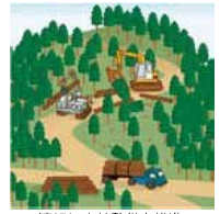
適切に森林整備を推進

昨年4月の森林法改正により、今年4月以降、森林の土地の所有者となった方は市町村長への事後届出が義務づけられました。 【届出対象者】 個人・法人を問わず、売買や相続などにより森林の土地を新たに取得した方は、面積に関わらず届出をしていただくことになります。 【届出期間】 土地の所有者となった日から90日以内に、取得した土地の市町村長に届出をしてください。