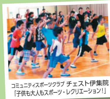
コミュニティスポーツクラブ チェスト伊集院 「子供も大人もスポーツ・レクリエーション！」