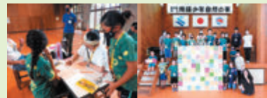
【「100の笑顔」作成と完成を喜び合う参加者】

100枚の笑顔の似顔絵を描き、パネルに貼り付けて一つの作品に仕上げる活動を行うことで、みんな笑顔で喜び合うことができました。