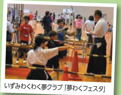
いずみわくわく夢クラブ「夢わくフェスタ」