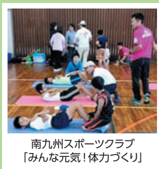
南九州スポーツクラブ 「みんな元気！体力づくり」