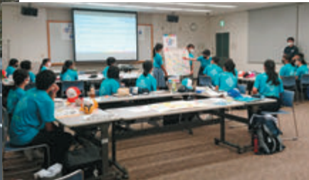
生徒実行委員 部会別活動