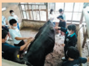
中学生の魅力体験学習

GAPとは GAP (Good Agricultural Practices : 農業生産工程管理) とは、農業において、食品安全、環境保全、労働安全等の持続可能性を確保するための生産工程管理の取組のことです。