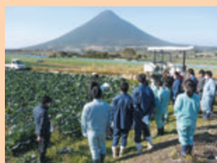
県内先進農家視察（キャベツ）