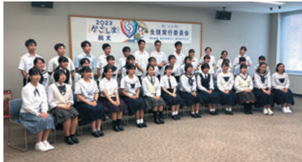
生徒実行委員会委嘱状交付式