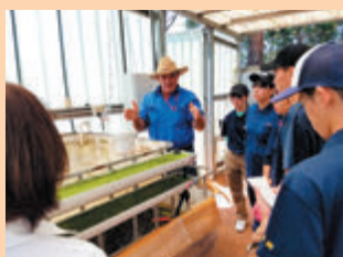
海外等での研修（オーストラリア）

国内外で先進的な取組を行う農家等での視察を行うとともに、スマート農業や6次産業化、持続可能な農業生産をめざすGAP等に関して外部講師を招聘し、研修会を実施するなど、特色ある農業教育を行っています。また、魅力体験学習の実施やPR動画の活用により、小・中学生に農業の魅力を伝える取組を行っています。