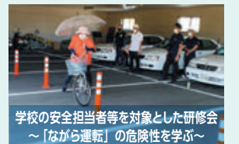
学校の安全担当者等を対象とした研修会 ～「ながら運転」の危険性を学ぶ～