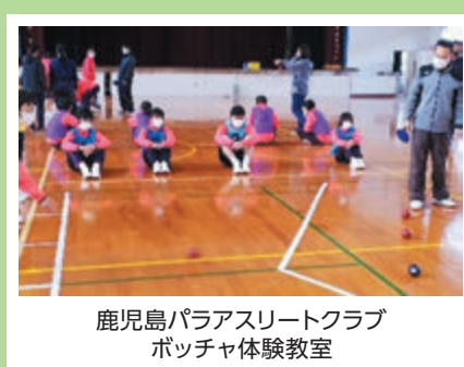
鹿児島パラアスリートクラブ ボッチャ体験教室