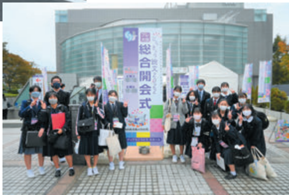
とうきょう総文2022プレ大会総合開会式視察

※ 生徒実行委員会の活動の様子や各種PRイベント、公募事業等については、県教育委員会ホームページを御覧ください。