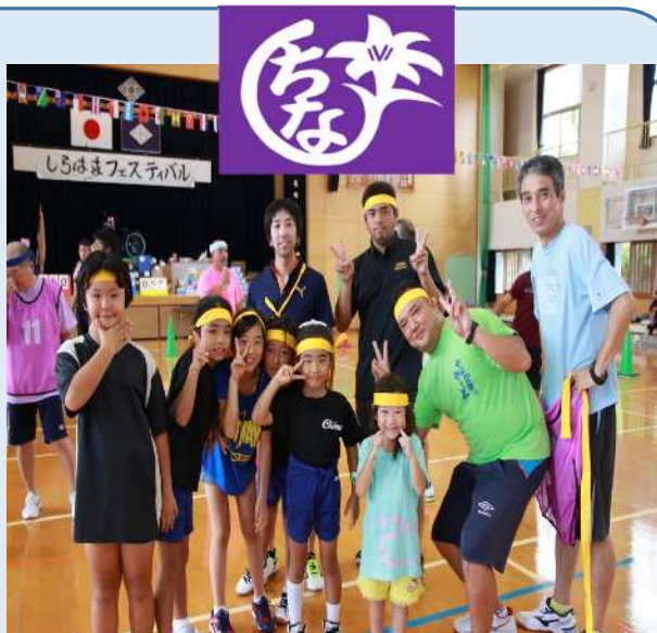
字主催：しらはまフェスティバル(小運動会)

将来の目標は、中高生が地域資源を知り、活用して「字づくり」や「ビジネス」を提案して、字内外の方々に島料理を振る舞う仮称：「ちな字レストラン」を立ち上げて地域の活性化へつなげることである。