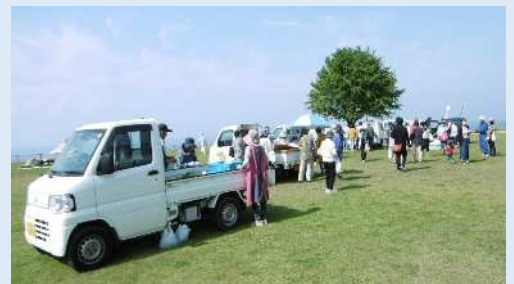
「軽トラ市」開催の様子