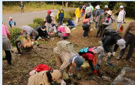
令和元年11月3日 宮ノ山遺跡入り口 神話のふるさと公園に薩摩野菊を植栽

神話活動では、難しいといわれる神話を小学生でも理解できるように朗読劇や神話の歌をつくります。神話にまつわる場所をたずねその雰囲気を感じます。漁業では定置網漁船に参加し400種類ともいわれる魚にふれ、その日水揚げされた新鮮な魚を笠沙ならではの豪快な料理でいただきます。