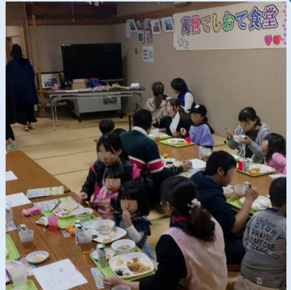
地元の子ども食堂にも食材を提供しています

企業や個人での食品ロスの軽減を促進するとともに一人親世帯や支援が必要な方々へ定期的に食材を届けることで、より安心して利用できるフードバンク活動の確立を目指します。また、ボランティア活動のマッチングや自治体のポイント制度の活用など、高齢者の方々と一緒に地域を盛り上げたいと考えています。