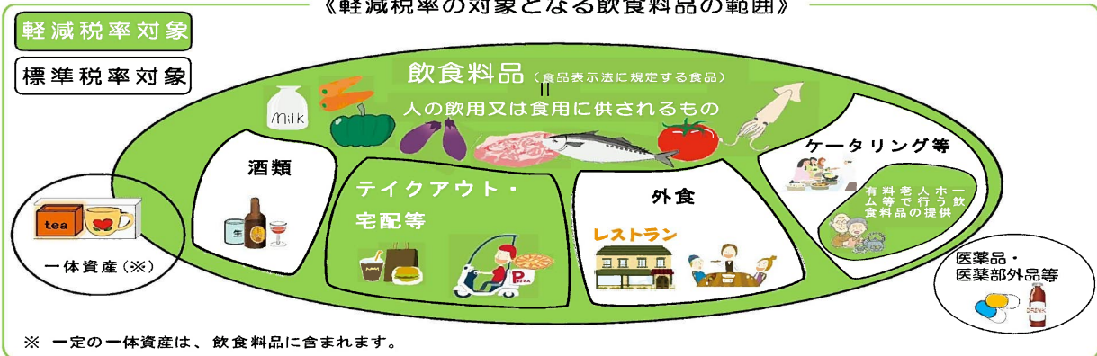
《軽減税率の対象となる飲食料品の範囲》