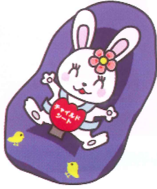
チャイルドシート着用推進シンボルマーク「カチャピョン」