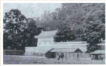
〔御角櫓(尚古集成館蔵)〕

平成27年2月、県と「鶴丸城御楼門復元実行委員会」は「鶴丸城御楼門建設協議会」を設立し、御楼門の建設に取り組むこととしました。同協議会では、平成32年3月の完成に向け、現在、必要な作業を進めているところです。