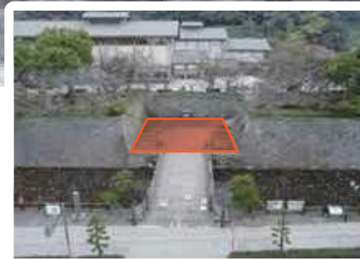
〔御楼門建設予定地〕

火災で消失する前の明治初期に撮影された写真や、残されていた礎石の痕跡から、主柱や脇柱などの大きさが判明しており、類似例や文献資料などを参考に建設することとしています。