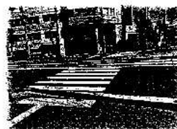
←歩行体験予定 横断歩道

訓練は繰り返しが大切です！ 昨年に引き続き今回は、 交通安全講義、その後シルバーカーを押しておうとつ凸凹のある横断歩道 歩行体験と、 ライン (前回同様)を使って検索してみたいと思います。 ラインを使った検索に慣れていきましょう。