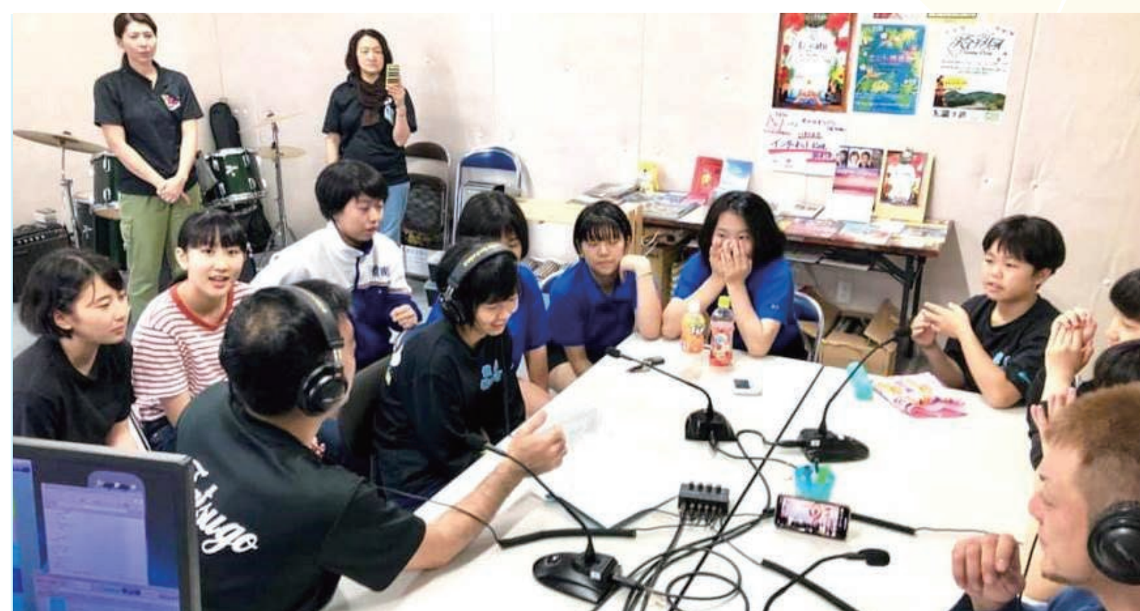
【龍郷町における地域コミュニティ放送による情報発信】

地域コミュニティ放送の奄美大島4局(奄美、宇検、瀬戸内、龍郷)、垂水市局、始良市局と地域自治体、県域放送のMBCラジオ、エフエム鹿児島、東京のレインボータウンFM、龍郷町内の学校、自治会等地域団体。