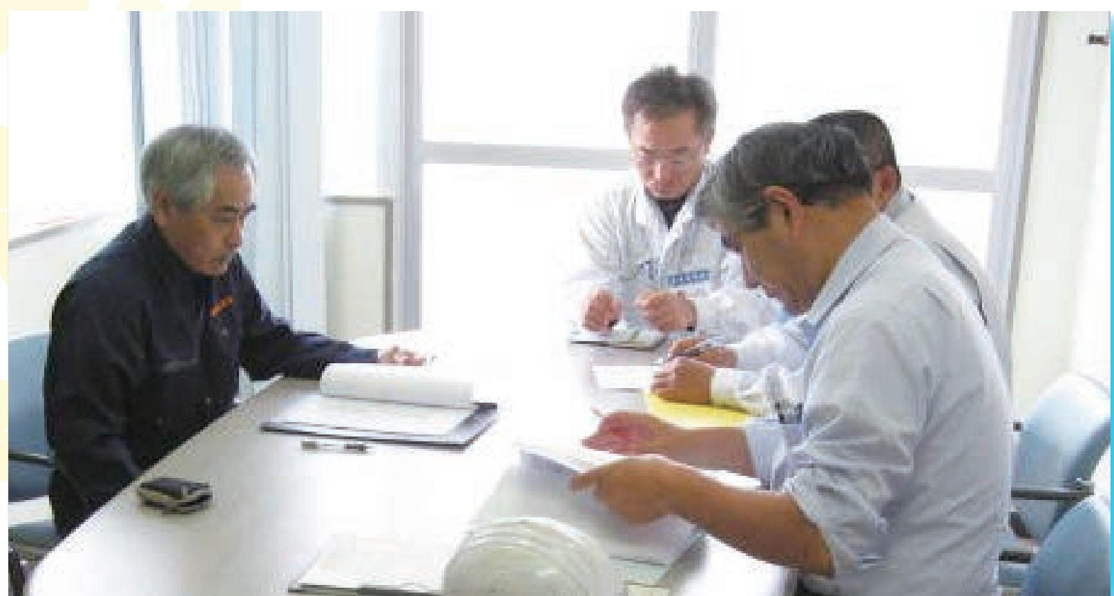
【地域コミュニティ放送の開局・保守への技術支援、提案】

これらを通じて、行政・企業やNPO法人、住民がつながる取組の支援を目的に活動しています。