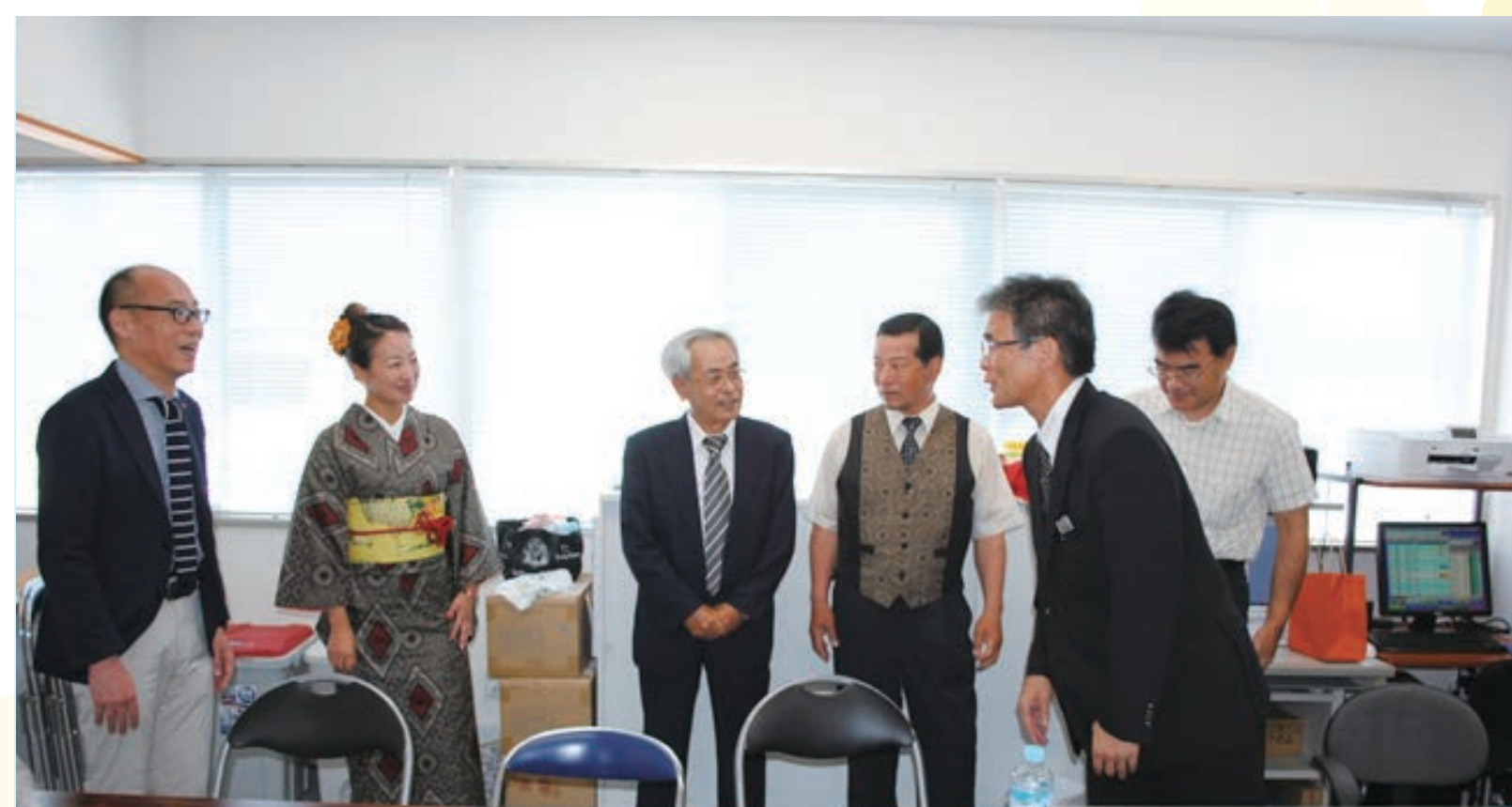
【奄美、県域、県外へ地域情報の広域連携に向けた支援】

地域の役場職員、中学校生徒等が参加した、地域や行政の情報、芸能などの番組制作、放送の一コマ。番組名:「ワンジーの放送委員会」