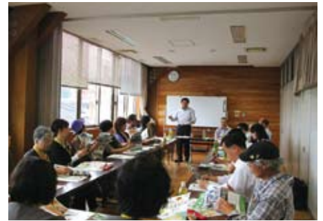
グリーン・ツーリズムの研修会の様子