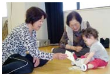
片泊地区老人会との交流

積極的に野いちご園児と学校や地区老人会との交流を図り、地域で子育てができる環境づくりに努めています。