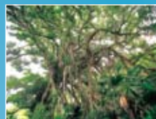
平島 (ガジュマル古木)