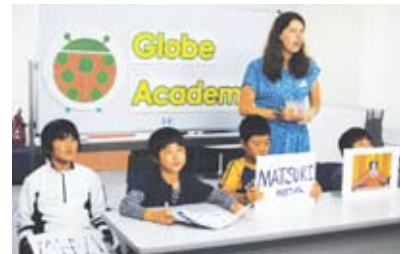
海外事業 Globe Academy