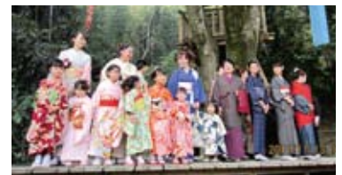
諸岡和裁教室着物ショー