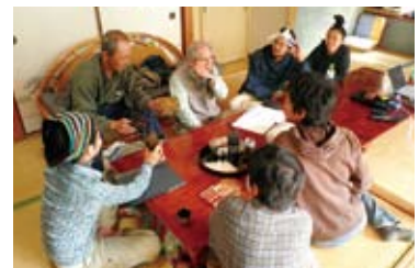
移住定住支援活動

トカラ列島の最大の課題は島の持続的発展を担う若者人材の確保・育成です。このため都市の若者の呼び込み作戦を2年前から展開し、12家族の移住に繋がっています。移住者は子供を産み育てる年代であるため、島の維持・発展を担う人材として島の期待は大きいです。