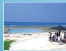
口之島 (海中プール)