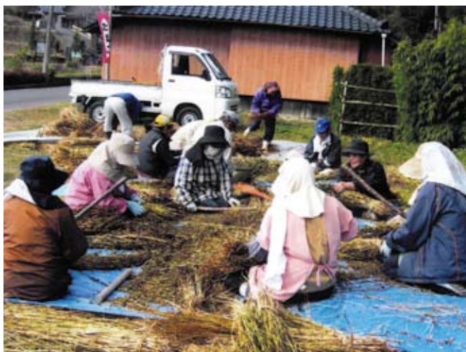
休耕農地を活用した「北山そば」の収穫

地域ブランド化に向けて「そば」を生産しています。生産だけでなく、そば打ち講座や集落毎(4地区)の食べ歩き行事を開催しています。「茶いっぺ処 北山茶屋」でも北山そばを食べることができます。これらの他にも、空家活用、荒廃地活用、竹林整備の促進などに取り組んでいます。