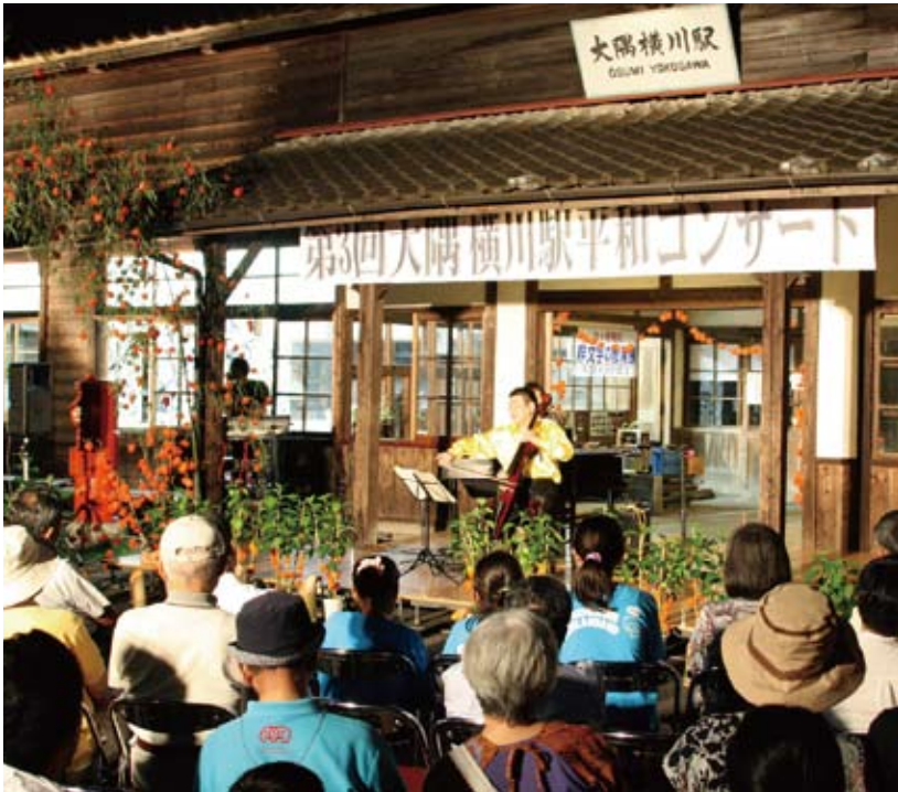
100年以上前の姿の駅舎前で行われる平和コンサートは格別です。