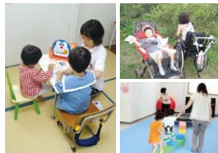
セラピストによるバランスと創造性の療育

障害児(者)の発達・学習・生活支援やこれらの人々が暮らしやすいまちづくりに関する事業、及びこれらの事業に関する専門家や施設の支援、研究活動などの事業を行うことにより、障害児(者)とその家族が地域で安心して暮らしていける社会実現を図り、もって公益の増進に寄与することを目的としています。