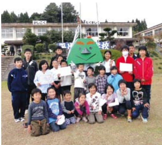
子どもたちと文化スポーツデー