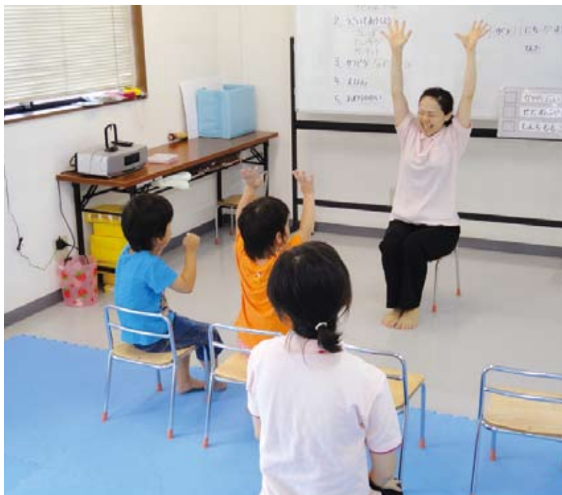
社会性を養う集団療育