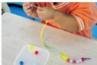
セラピストによる療育(ビーズ 通し)

発達・発育に不安を抱える子どもたちに1人ひとりの個性を尊重したST,OT,PT,保育士,臨床心理士による発達支援(個別療育と集団療育)を提供します。