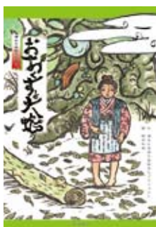
蒲生の民話伝説絵本「おおくすと大蛇」の表紙

蒲生の伝説(民話)をもとにした絵本作りで、かもう親子読書会、蒲生町史談会、始良市立蒲生小学校・始良市立蒲生中