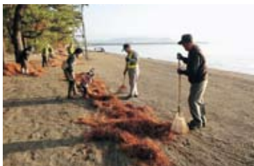
協働でのクリーンアップ風景

NPO・子どもたち・近隣自治会・山野安全パトロール隊(SAP)・行政等様々な主体が、できる事を楽しくやる。戦略的にコーディネートし、国立公園指定を受けました。