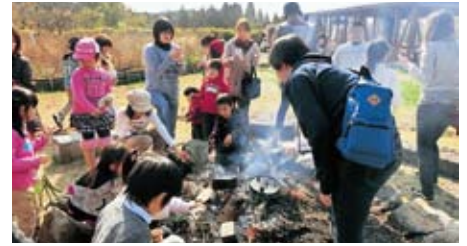
たき火のサークルでは、薪のくべ方や熱の利用を学びます。

子どもの自然体験活動を通し、地域住民がつながり合えるようなイベントの開催等や子育て支援施設のネットワークづくり等を行っています。