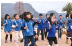
◀地域のイベントに参加