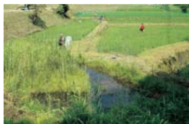
子どもたちと行うビオトープの調査

環境省のモニ1000事業の実施団体として、野鳥や野草、夜行性動物などのモニタリング調査を行うほか、ビオトープの維持活動も行っています。