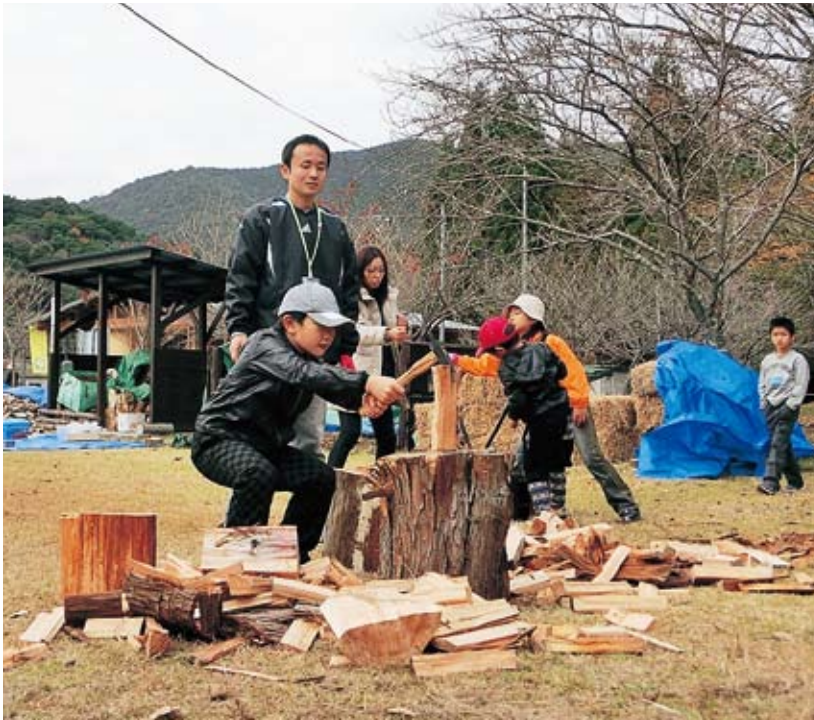
間伐材を使った薪割り。十曾こどもの森で使う熱源は薪であり、体験活動で割った薪も用いられています。