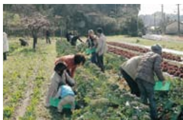
旬の野菜を食べる会

棚田の修復再生・維持管理のために、棚田オーナー制事業や耕作放棄地での草刈りなどを実施し、オーナーやボランティアの形で、町の人々との交流を進めています。