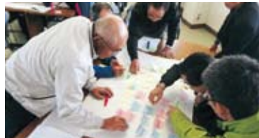
ワークショップ風景

共生・協働を進めるために、住民主体の地域未来ビジョンの策定をワークショップ形式でサポートしています。また、環境や福祉等様々な視点からのまちづくり支援も行っています。