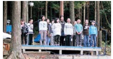
森のステージは、立木に共鳴して心地よい響きの空間。ボランティアが作成した切り株の椅子がステージを囲んでいます。