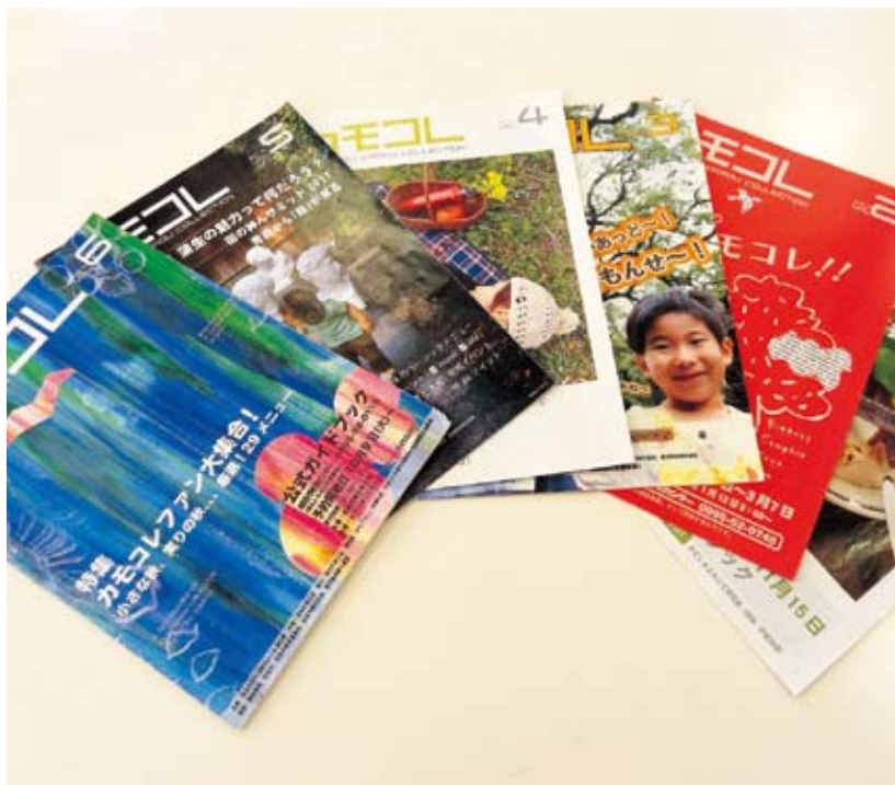
2009年の秋よりこれまで6回の「カモコレ」を実施し、蒲生に住むマデヒトが発信する様々なジャンルのメニューを紹介しています。カモコレの認知が進むことによる「蒲生郷」のブランディング促進も狙っています。