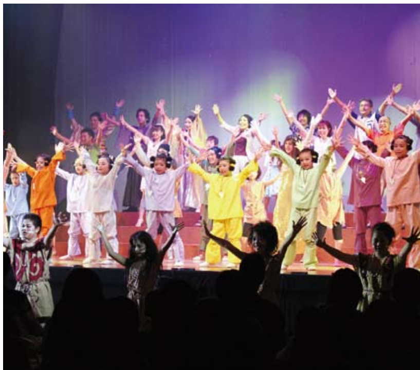
ひかるの夏～龍馬からの伝言～