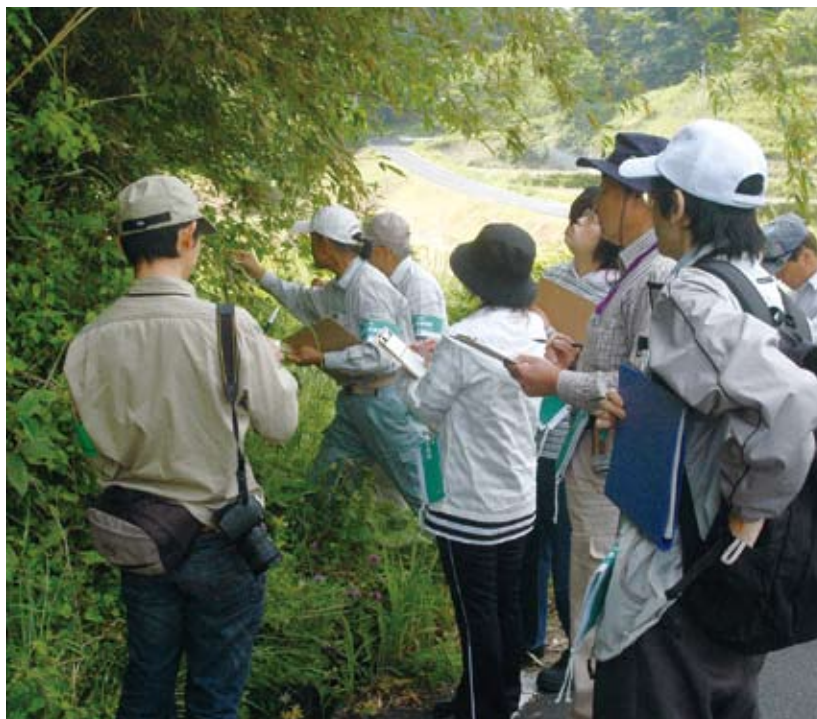
毎月行っている草花調査