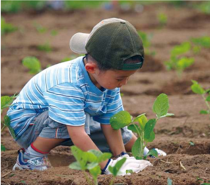
「霧島畑がっこ」大豆組では、大豆の植え方から食べ方までを体験します。