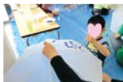
絵画教室で自分の傘をデザイン

自分を表現することが苦手な子ども達が絵画などを通して自分を表現し、自分の存在に自信を持たせ、また音楽の楽しさを体全体で味わい、その喜びをとおり、旋律を作ることへの興味、そして、音感、動作、共感を育んでいきます。