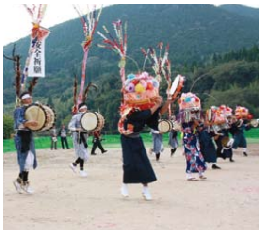
17年ぶりに復活した「川添太鼓踊り」