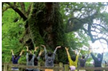
カモコレの人気メニュー「蒲生でゆるゆるストレスケア」

実際に来て触れてもらうことで、蒲生の魅力を知ってもらい、蒲生との絆を深めてもらいたいとの気持ちから、来てもらえるような「仕組み」をつくる事業です。