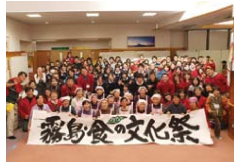
全国からの来場者で賑わう「霧島・食の文化祭」

目指すのは「超ローカルで田舎っばい」食育活動です。地域の食文化を掘り起こし、食を支える農業や地域の風土を、市内外の人々が交流しながら学ぶ活動の展開を目的としています。