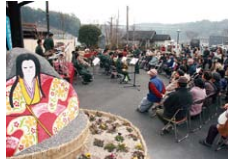
第3回ひな祭りイベント

大隅横川駅舎(国登録有形文化財)の保存及び活用並びに同駅の周辺整備を図るために具体的計画を立案し、実現に向けて取り組んでいくことにより霧島市横川町の活性化に資することを目的とした団体です。