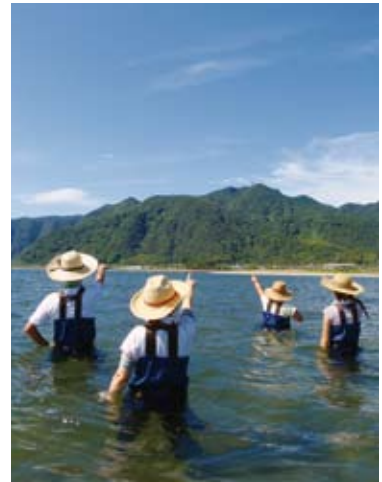
エコツアー「ヴェーダウォーク」

自然環境調査をもとに、環境教育をとおりして鹿児島の自然や文化を後世に引き継いでいく環境保全活動を行っています。