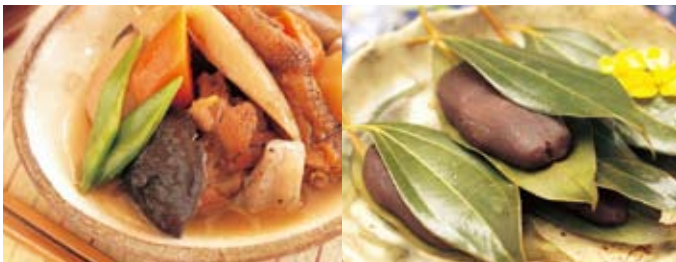
「霧島たべもの伝承塾」でつくった「きいこん」(左)と「ケセン団子」(右)

「霧島たべもの伝承塾」を毎月実施し、郷土料理の継承を行っています。毎年11月には「霧島・食の文化祭」を開催し、地域の食文化を「地域の力」として、全国に発信しています。現在1000品以上の霧島の家庭料理を記録し続けています。