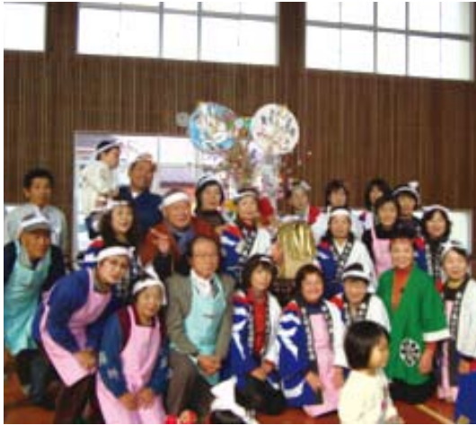
子育て応援隊「みんみん」