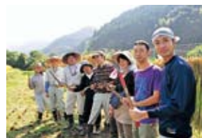
棚田食育士養成講座

命を育む、水・空気・森・田畑を理解し、農業と食育を同時に学び、食育のプロをめざす