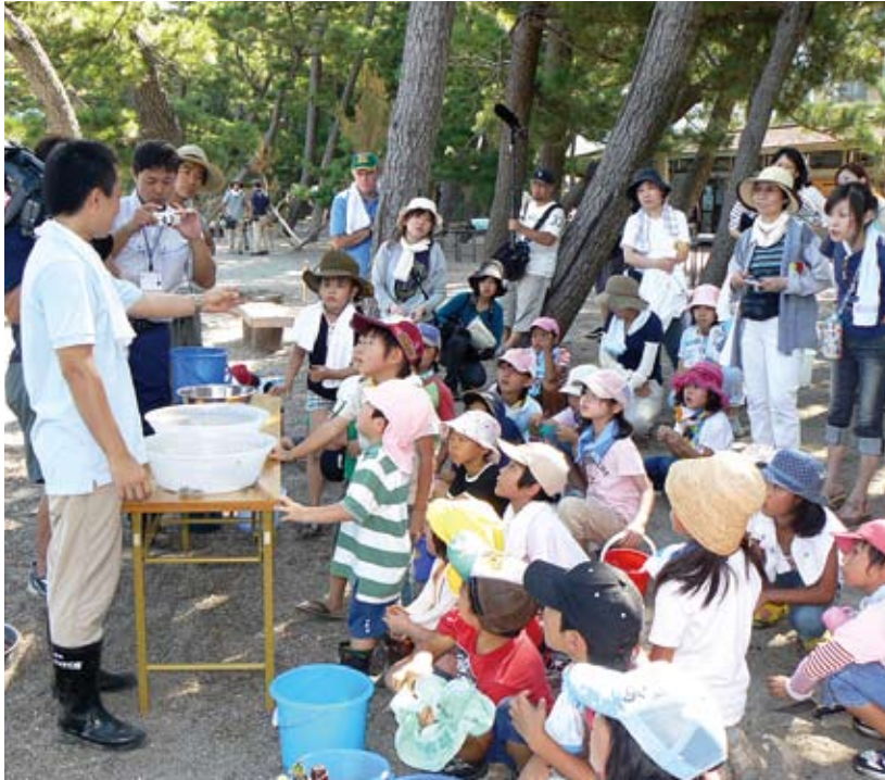
観察会と子供たち