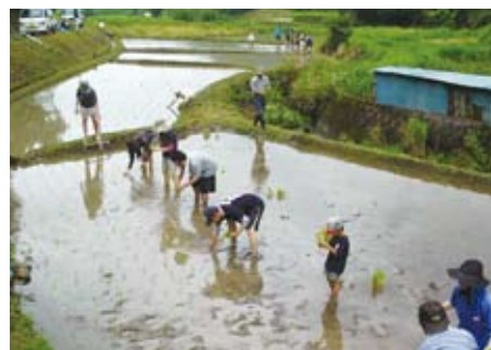
オーナーの皆さんによる田植え

漆集落の里山と生き物たち、人の暮らしを丸ごと「屋根のない博物館」ととらえ、貴重な里山の資源を未来につなげるための調査研究、保全活動を行う団体です。