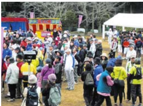
地域おこしイベント(歩こう会)の様子

共生・協働型仕組みづくり組織として、始良市北部、山間地域の北山校区(人口460名、高齢化率64%)の地域再生をめざし、自治会長を中心に住民の結集を図っています。郵便局跡を利用した「茶いっぺ処 北山茶屋」を拠点に、地域活性化の取組を行っています。