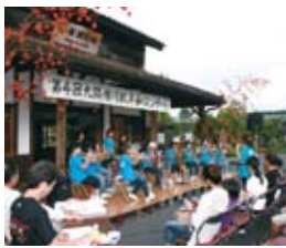
平和コンサートでの横川小学校の演奏

昭和20年7月30日、駅舎が米軍機による襲撃を受け、その弾痕が駅舎の柱等にまだ残っています。平和を願いこの駅舎を平和の発信地にするために、平成19年から霧島国際音楽祭アーティストを