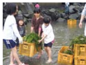
「日本疎水100選 竹中池」の藻の除去作業

「日本疎水100選」に選定された竹中池湧水の藻の除去など、観光客が訪れる夏を前に地区民と子ども会が一緒になって行っています。