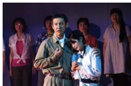
ひかるの夏～龍馬からの伝言～

年代や職業などが異なるさまざまな人達と一緒に汗を流し共感できるものを創り出すことによって、誇りと自信を持てる地域を創造することを目的とする団体です。